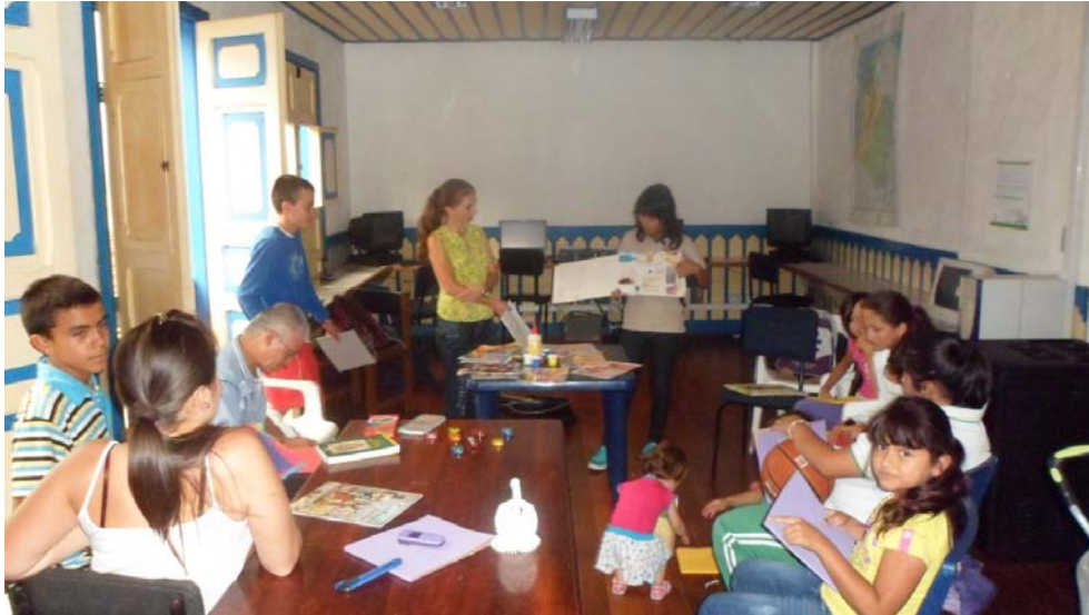
6 Taller Formador de formadores en Marsella, 2012. Tomado registro personal.