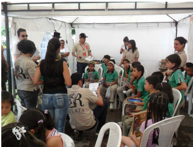
4 La poesía es un viaje en la campaña Leer es mi cuento, RCN, 2011.

una autoevaluación sobre la práctica realizada, las dificultades y el cumplimiento de esta planeación.