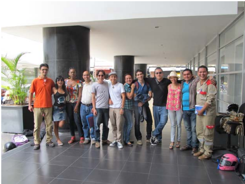
1 Integrantes La poesía es un viaje 2012, fotografía tomada del registro personal.

Este testimonio da cuenta de cómo el taller literario es tanto una comunidad afectiva donde sus miembros están unidos por propósitos comunes como una comunidad de discurso donde lo común es la búsqueda de un sentido de la creación y expresión por medio de la palabra y de una práctica de la cultura más dinámica e integrada a los procesos sociales.