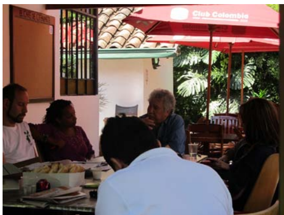
5 Encuentro de talleres RELATA del Noroccidente del país con el poeta Juan Manuel Roca, en Otraparte, Medellín. Feria del libro 2012