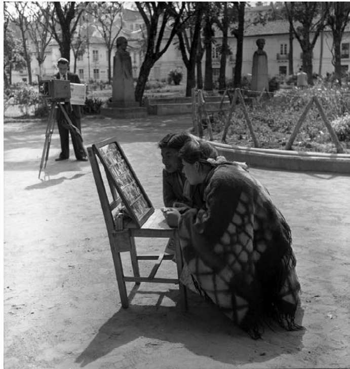
“La galería”, Archivo Blomberg, La Alameda, Quito, 1948