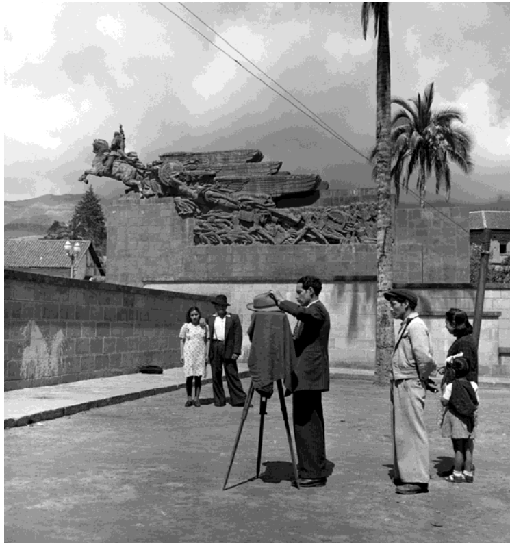
Archivo Blomberg, La Alameda, Quito, 1948