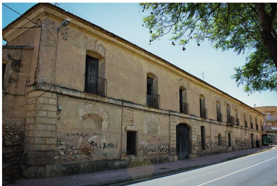
Ilustración 4. Fachada principal de la posada de Librilla

ROSARIO BAÑOS OLIVER; FRANCISCO SEGADO VÁZQUEZ; JUAN CARLOS MOLINA GAITÁN