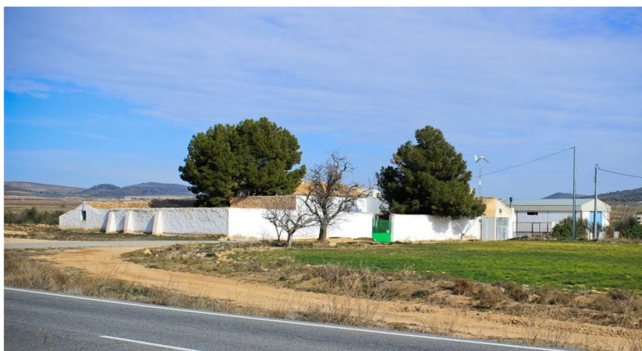
Ilustración 2. Venta de los Hitos, en Yecla, junto al camino de Albacete a Alicante

Sin embargo, a pesar de los numerosos ejemplos existentes sobre proyectos de ventas y posadas, la realidad es bien distinta y apenas hay ejemplos de proyectos de «casas de posadas» o paradores ejecutados por arquitectos. Por norma, estos establecimientos pertenecen a un tipo de arquitectura popular, de una o dos plantas, de carácter anónimo y con acabados pobres y descuidados [Ilustración 2].