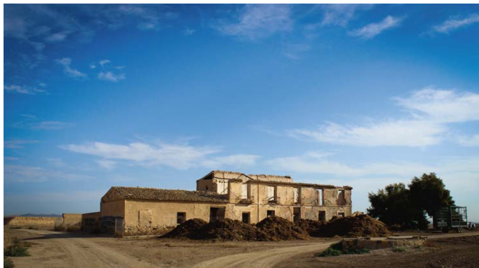
Ilustración 8. Venta de El Jimenado, en el camino de Murcia a Cartagena

De las que aún permanecen en pie, la mayoría han sido intensamente transformadas, reconvirtiéndose en su mayor parte en residencias privadas, casas de labranza o de recreo. En algunos casos, a pesar de haber sufrido numerosas alteraciones, siguen desempeñando la función hostelera, como restaurantes, conservando su estructura originaria. En otros, han sido demolidas y sobre su emplazamiento se ha edificado una nueva venta o restaurante, debido a su emplazamiento estratégico. Pero las hay que han sufrido peor suerte y se encuentran abandonadas y en la ruina absoluta, lo que las aboca a su desaparición [Ilustración 8].