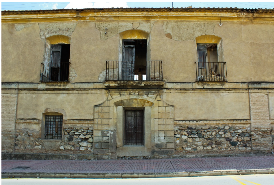
Ilustración 6. Fachada principal de la posada de Librilla donde se aprecia el acceso peatonal a la hospedería

Se formaliza con dos alturas y un eje de simetría en el acceso central a la posada, el acceso peatonal [Ilustración 6]. A ambos lados de esta se hallan dos accesos para la entrada y salida de los carruajes. Los tres accesos son rematados con un arco que, junto con sus jambas, son definidos con sillares de cantería con un suave almohadillado. Una de las entradas de carros, ya que el otro acceso los ha perdido, cuenta con dos defensas en la parte baja para evitar las rozaduras de los carros al pasar entre ellas. También presentan las jambas de estas puertas un esviaje para facilitar las entradas y salidas de los carros. La fachada se encuentra toda ella desprovista de elementos decorativos, a excepción de un escudo en piedra caliza en la esquina oeste de la fachada principal que hace referencia a José María Álvarez de Toledo y Gonzaga, el constructor de la posada 18 .