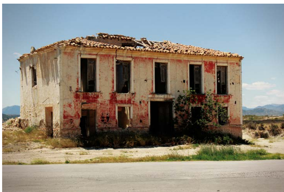
Ilustración 1. Posada de la Estación. Calasparra (Murcia).

La aparición de esta tipología de equipamiento viario fue, en definitiva, consecuencia de la necesidad de hacer un alto en el camino en el transcurso de un viaje, para tener un lugar donde poder descansar y guarecerse de las inclemencias del tiempo y poder parar y alimentar a las bestias. En el siglo XIX, además, surgió una nueva razón para el emplazamiento de estas estaciones de descanso: la llegada y el florecimiento del ferrocarril propiciaron la aparición de estas construcciones en los lugares donde este tenía parada. [Ilustración 1]