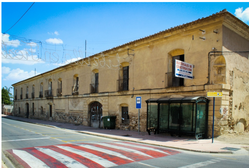
Ilustración 5. Fachada principal de la posada de Librilla donde se aprecia la simetría de la misma

La fachada principal responde a los patrones de la arquitectura neoclasicista que promovían las academias en el siglo XVIII [Ilustración 5].