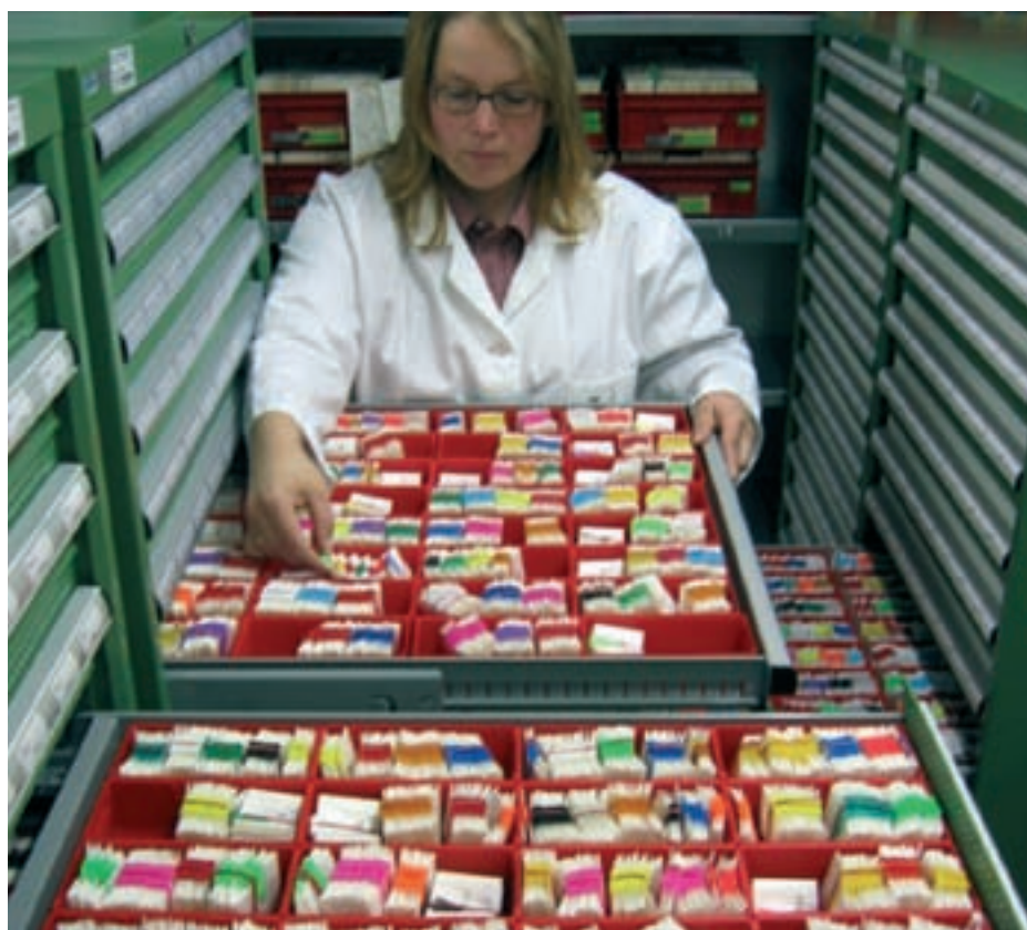
Blick in das Samenlager von GABI-Kat

Mit einem aus dem Bodenbakterium Agrobacterium tumefaciens stammenden, natürlichen System zur Genübertragung konnten wir für 16.900 der insgesamt 26.000 normalerweise intakten A. thaliana -Gene zum Teil mehrere unterschiedliche "Knock-out"-Mutanten erzeugen. T-DNA-Insertionsmutanten können in A. thaliana leicht hergestellt werden. T-DNA erzeugt eine geringe Anzahl an mutierten Loci pro Pflanze und die T-DNA-Markierung kann leicht und direkt mittels PCR nachgewiesen werden. Die für den Umgang mit T-DNA-Insertionsmutanten notwendige Genetik ist einfach, insbesondere im Vergleich zur Verwendung von autonomen Transposons oder Zwei-Komponenten-Transposon-Systemen als Insertionsmutagen. Von der internationalen Forschungsgemeinschaft wurden mehrere T-DNA