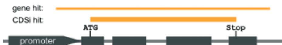
Definition von "Gen-Treffern" (gene hits) bei GABI-Kat

Die im Rahmen der deutschen Pflanzengenom-Initiative GABI (Genomanalyse im biologischen System Pflanze) am Kölner Max-Planck-Institut für Züchtungsforschung erstellten GABI-Kat-Linien werden an ein internationales Zentrum für pflanzliche Ressourcen übergeben und damit weltweit frei zugänglich gemacht. Bei den GABI-Kat-Linien handelt es sich um eine Sammlung genau definierter und katalogisierter Gendefekt-Mutanten der Referenzpflanze Arabidopsis thaliana . Das Studium der GABI-Kat-Linien führt Wissenschaftler zur Funktion der jeweils betroffenen Gene und deren Beitrag zu wichtigen pflanzlichen Eigenschaften. In Kulturpflanzen kann damit genau und schnell nach besseren Varianten wichtiger