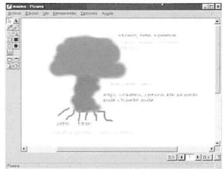
Pizarra virtual de Netmeeting sobre la que interactuaban ambos grupos siguiendo las instrucciones por voz de un moderador

Las comunicaciones se realizaban en tiempo real mediante videoconferencia. Con cinco horas de diferencia, los alumnos de Mar del Plata realizaron la actividad por la mañana mientras que los alumnos de Badajoz lo hacían por la tarde.