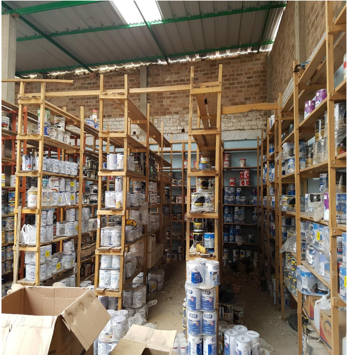
Anexo 4. Fotografía de los andamios ubicados a la mano izquierda del almacén.