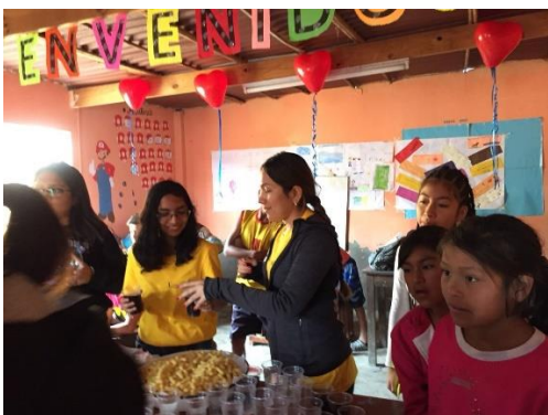
Ilustración 4: Madre ganadora de una canasta por el día de la madre