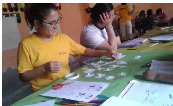
Tabla 5: Desarrollo de dinámicas grupales que promueven la integración y refuerzan el aprendizaje de los niños de la escuela sabatina