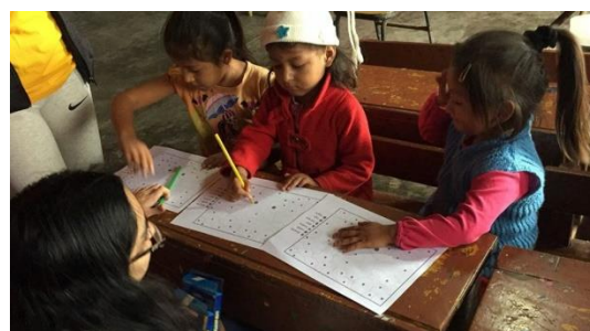
Ilustración 8: Niños desarrollando tarea brindada por las integrantes del grupo