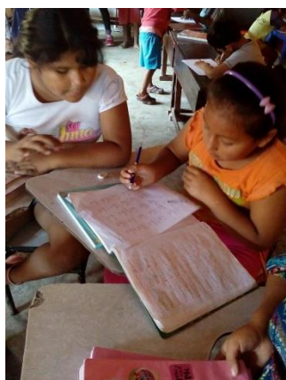
Ilustración 2: Actividad “Torres para mi es...” realizada por los niños