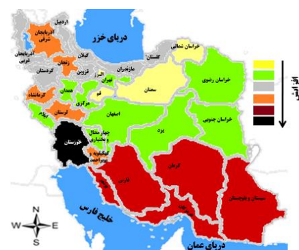
شکل-۲. نقشه فراوانی عقرب زدگی در ایران

به هر حال در برخی مواقع اردوگاههای دائمی و پادگانهای نظامی و یا اردوگاههای موقت در رزمایشها و بحرانها بدون توجه و یا اطلاع از زیستگاههای طبیعی موجودات خطرناک ساخته می‌شود و البته در مواردی هم این امر اجتناب ناپذیر است. در این گونه مواقع بررسی اقدامات کنترلی در حین استقرار نیروها و یا بلافاصله پس از آن برای ممانعت از گزیدگی بایستی صورت گیرد.