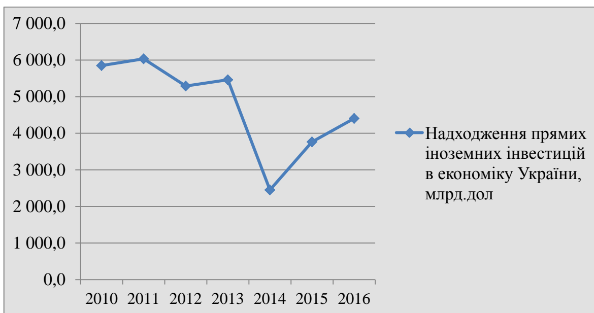
Рис.1 Динаміка надходжень прямих іноземних інвестицій в економіку України за 2010 – 2016 роки, млрд..дол.[8]

Одним з найважливіших факторів впливу на економічний розвиток України є обсяг залучених інвестицій. Враховуючи обмеженість фінансових ресурсів і їх постійну необхідність, розвиток ринку іноземних інвестицій є особливо важливим завданням у контексті трансформаційних змін економіки України, її структурної перебудови та інтеграції до Європейського Союзу. Європейський Союз є найбільшим іноземним інвестором України, що інвестує більше ніж США та Росія разом. У 2016 році 69,3% прямих інвестицій (акціонерний капітал) в економіці України були з країн ЄС [8]. Україна прагне стати територією європейських інвестицій, а створення сприятливого ринку іноземних інвестицій є одним з першочергових завдань. Однак, динаміка іноземних інвестицій в економіку України за останні п'ять років є спадаючою, що пов'язано з ескалацією конфлікту на сході країни та низкою проблем у фіскальній сфері (рис.1.)