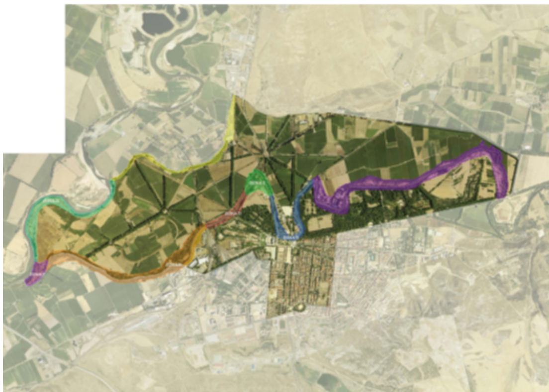
Ortofoto de las zonas declaradas Paisaje Cultural por la UNESCO, con las zonas de huertas y jardines al norte del río Tajo y la zona urbana al sur del mismo.

La singularidad intrínseca del territorio, y la modelación pausada de su paisaje, ha hecho que el ámbito declarado como Paisaje Cultural, aúne espacios tan diversos como un Palacio Real, las zonas de huertas reales, caminos y jardines del siglo XVIII, el río Tajo y sus meandros, sistemas de norias, esclusas y riego, y también un gran número de manzanas urbanas rectangulares, donde vive la población local. En este sentido, la delimitación del ámbito destila perfectamente esa armonía necesaria entre el medio urbano, el paisaje y el jardín que en Aranjuez forman un todo.