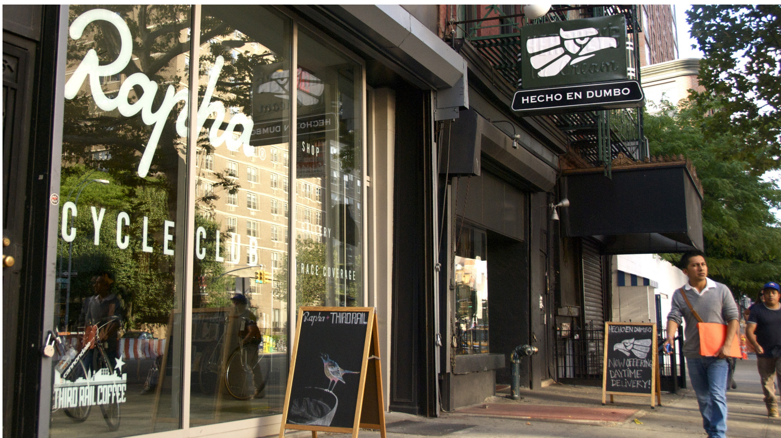
• Rapha Cycle Club New York

een interactieve ruimte ziet, kan op toekomstige investeringen inspelen. Ten eerste kan een nadruk op ontdekkingsruimten processen van serendipiteit opwekken en retailers en planners helpen om op toekomstige ontwikkelingen te anticiperen en investeringen aan te sturen. Om processen van serendipiteit in retailruimten mogelijk te maken, moeten klanten onverwachte dingen kunnen ontdekken en deze vervolgens binnen een context kunnen verkennen. Op het eerste gezicht klinkt dit misschien nogal theoretisch, maar wanneer een klant in een retailruimte een drone aantreft, heeft hij of zij verschillende mogelijkheden om de drone binnen een levensstijl te integreren, bijvoorbeeld voor fotografie of het maken van video's. Ten tweede leidt een multidimensionale retailruimte tot nieuwe interessante concepten.