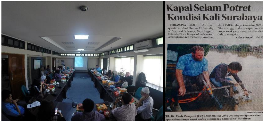
Afbeelding 5. Bespreking meetresultaten bij Jasa Tirta1 en kort verslag van metingen in Indonesische media

De meeste meetresultaten waren in het veld direct beschikbaar en werden on site besproken met alle partners. Zo nam men aan dat drijvende visvijvers door het overmatig gebruik van visvoer verantwoordelijk waren voor hoge nutriënt- en lage zuurstofgehalten. Uit metingen bleek dat de kwaliteit echter niet veel afweek van die op andere locaties (zowel aan de oppervlakte tot op diepten van 35 meter, gemeten met de drone). Wel zijn er duidelijke indicaties dat de waterbodem vervuild is door accumulatie van verontreinigingen. Geadviseerd is om naast de waterkwaliteit ook metingen aan de slibbodem te verrichten. Ook is inzicht in het gedrag van verontreinigingen van belang voor het ontwerpen van eventuele zuiverende voorzieningen.