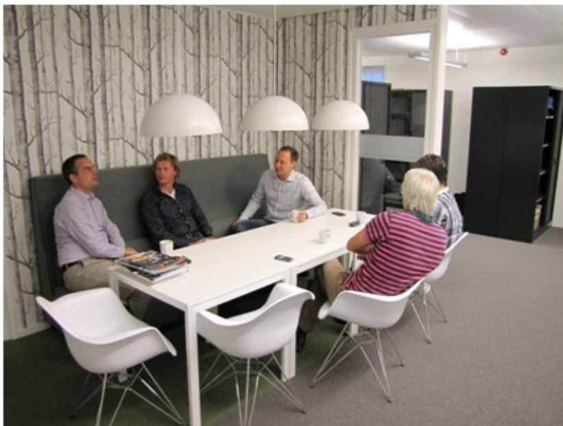
Afbeelding 7.1. Medewerkers van DGMR Drachten in hun nieuwe werkomgeving.

Het veranderproces is te typeren als een zoek- en leerproces met een grote betrokkenheid van management en medewerkers. De nieuwe ICT-middelen werden bijvoorbeeld al voor de verhuizing in gebruik genomen, zodat de medewerkers er al aan konden wennen en er tijd was om kinderziektes op te lossen. Het neveneffect was, dat medewerkers vaker gingen thuiswerken, waardoor ze elkaar op kantoor minder troffen. Dit onbedoelde gevolg is vervolgens ondervangen door nieuwe afspraken te maken over momenten en vormen van overleg en thuiswerken. Bij het uitwerken van het kantoorconcept kwamen belangrijke verschillen aan het licht tussen verschillende functiegroepen. De technisch specialisten bleken bijvoorbeeld wezenlijk andere opvattingen te hebben over (on)gewenst gedrag dan de leidinggevenden. In dit project resulteerden dit niet (zoals vaak) in een conflict of een compromis. Gezamenlijk werden werkbare oplossingen ontwikkeld, die voldoende ruimte lieten voor individuele verschillen. De bijbehorende gedragsafspraken werden vastgelegd in een 'afsprakenkaart', als basis om elkaar op gedrag aan te spreken. 8