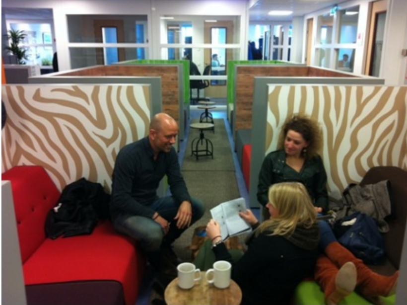
Afbeelding 7.3. Een HRM docent met twee studenten in de nieuwe werkomgeving.