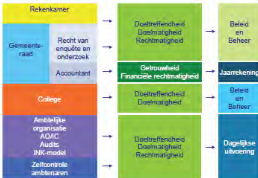
Figuur 2: de Controletoren (VNG, 2011, p12).