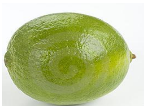
Figuur 1: een onrijpe citroen

Met het voorbeeld van de citroenen in het achterhoofd, kan gesteld worden dat veel eigenschappen dynamisch en daardoor veranderlijk zijn: je kan eigenschappen opvatten als punten op een (ontwikkelings-)lijn. In de context van talentontwikkeling spreken we van “dimensies in een ontwikkelingsperspectief”.