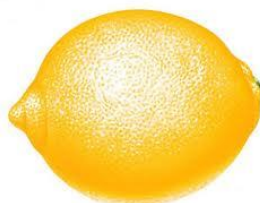
Figuur 2: "een citroen is geel"