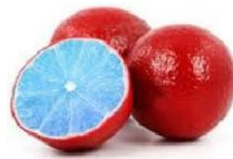
Figuur 3: zijn dit nog citroenen?