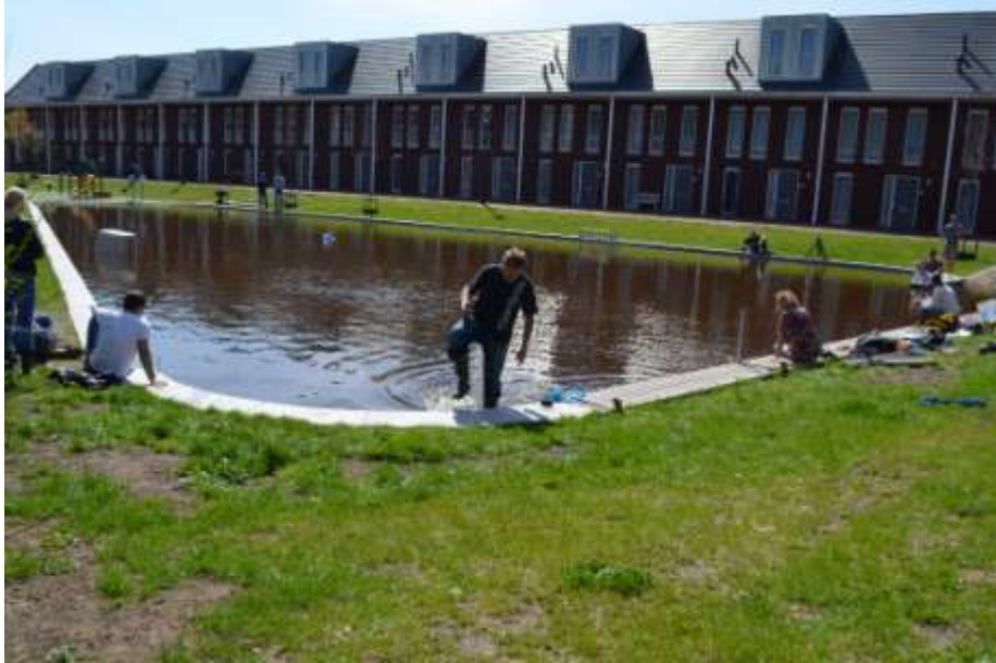
Afbeelding 1. Het waterplein in 's-Hertogenbosch tijdens de full scale test

De werking van het waterplein tijdens zware regenval is verbeeld in afbeelding 2. Bij droog weer of kleine buien is het plein niet anders dan alle andere pleinen. Bij hevige regen kan het tot circa 40 cm volstromen. Het regenwater van de wijk wordt met leidingen ondergronds verzameld. Bij kleine buien stroomt het rechtstreeks naar de Aa. De afvoercapaciteit langs deze weg is beperkt door een wervelventiel in de leiding. Bij hevige regen stuwt het water door de knijpende werking het wervelventiel op en stroomt daardoor via putten in het plein. Het plein is verdeeld in 3 vlakken, met steeds 3 cm hoogteverschil. Eerst stroomt het laagste deel vol, bij meer regen stromen het tweede en derde deel ook vol. Het plein is zodanig ontworpen dat het gemiddeld vijf maal per jaar water bergt. Over de volle breedte is een overloop gemaakt onder de banken. Als de berging op het plein geheel gevuld is, stroomt het extra water direct en zonder beperkingen naar de rivier de Aa via deze overloop.