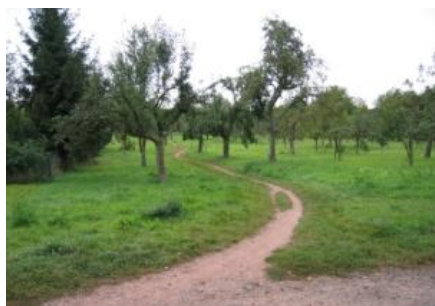
Een nieuwe boomgard

Het regionalpark bestaat uit een wegennetwerk van 1200 kilometer. Deze wegen hebben een 10 meter brede berm met laan, boom of struikbeplanting. Aan deze regioparkwegen zijn verschillende bouwstenen te koppelen. Dat kunnen plantsoenen en tuinen zijn, natuurgebieden of boomgaarden; dat kunnen historische bezienswaardigheden zijn of kunstinstallatie en objecten; avontuurlijke speelplaatsen of een horeca gelegenheid.