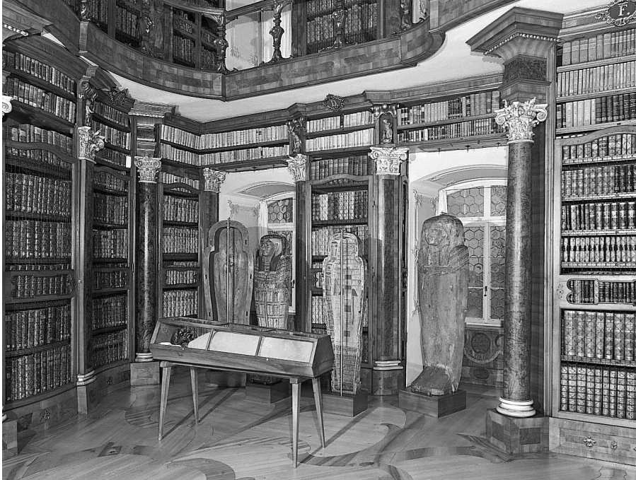
Mumie der Schepense in der Stiftsbibliothek St. Gallen