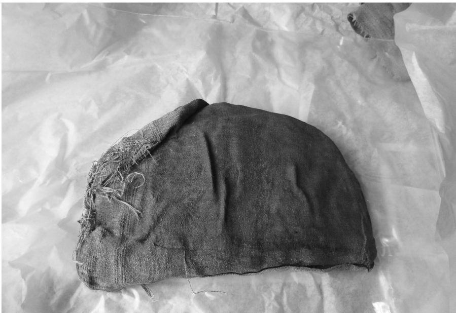
Leinenpäckchen mit mumifiziertem Organ der Schepense