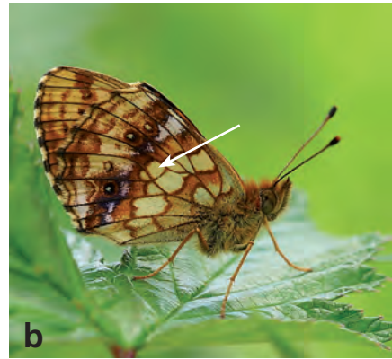
Abb. 1. (a) Brenthis daphne (Denis & Schiffermüller, 1775), Gemeinde Ottenbach (ZH), 6.7.2017 und zum Vergleich (b) Brenthis ino (Rottemburg, 1775).

Differenzialmerkmale: Hinterflügelrand bei B. daphne grossflächig violett übergossen, violette Zone bei B. ino schmaler und schärfer begrenzt; Mit Pfeil markierte Diskalzelle bei B. daphne konstant zweifarbig und distal dunkel gesprenkelt, bei B. ino hingegen bis auf einen schmalen dunklen distalen Rand gelb und nicht gesprenkelt (Baudraz & Baudraz 2016; www.eurobutterflies.com, abgerufen am 24.1.2018).