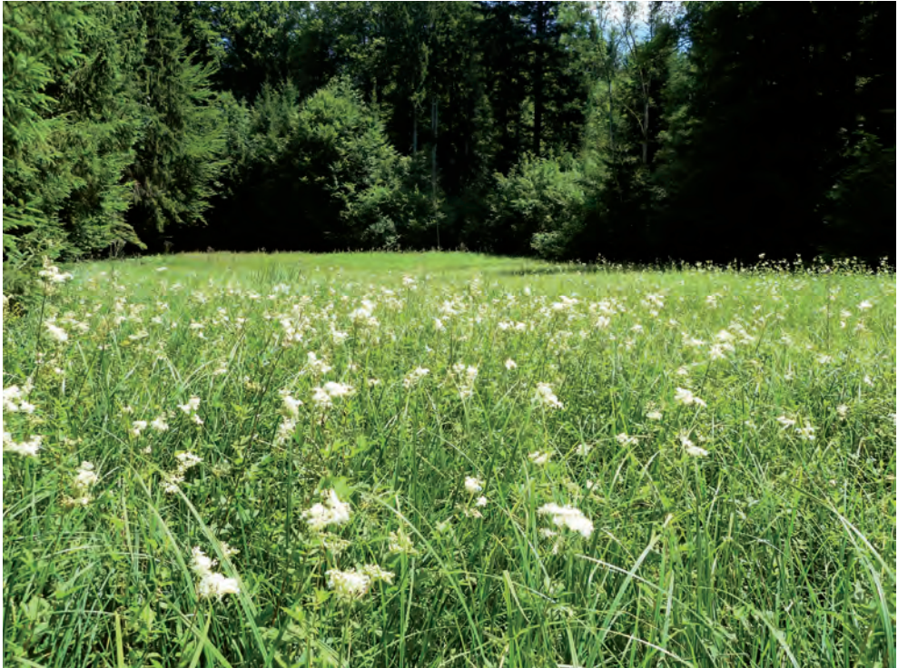
Abb. 2. Fundort von Brenthis daphne (Denis & Schiffermüller, 1775), Flur Bötschgen, Gemeinde Ottenbach (ZH), 10.7.2017. Mischwaldmantel angrenzend an Spierstaudenflur.