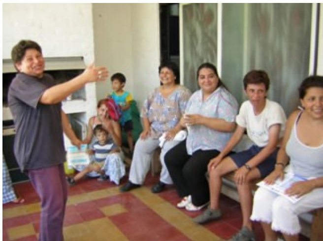
Figura 4. No grupo de promotoras houve uma tendência ao equilíbrio de forças e à cooperação entre elas.

Na relação entre as promotoras e o restante dos vizinhos, a evolução das práticas sociais – no marco dos projetos de promoção da saúde – passou de uma situação na qual ambos se percebiam como “dominados” com relação à equipe de saúde e à posse do conhecimento para a promoção da saúde, a outra de dominação/dependência, na medida em que as promotoras se apropriavam desse conhecimento.