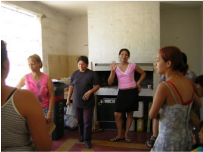
Figura 2 – Grupo de promotoras sociais de saúde em reunião de organização de tarefas.