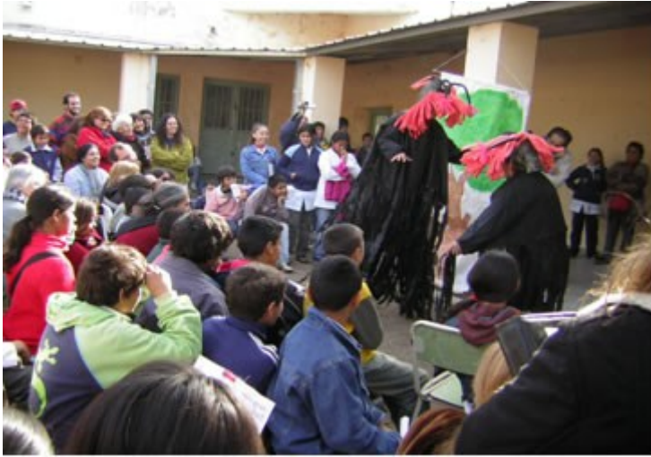
Figura 5. A participação da população nos projetos comunitários facilitou a acessibilidade cultural à UPAS e à sua oferta de saúde.