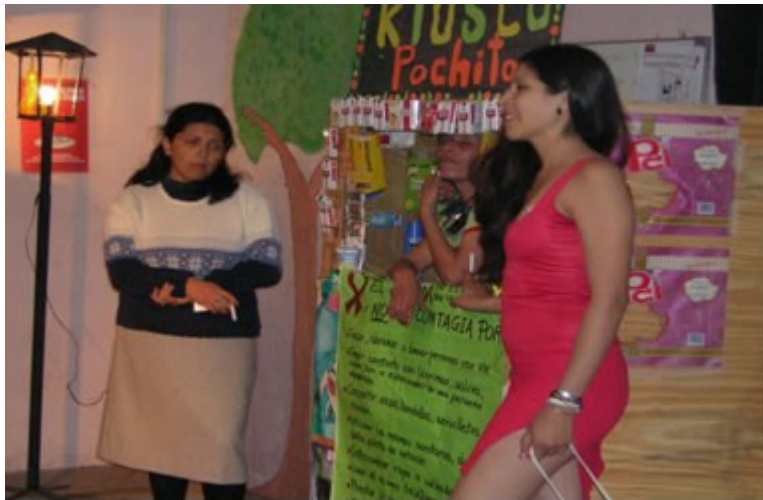
Figura 3 – Promotoras de saúde em Obra Teatral “El Kiosco e la Pochita” (Projeto de Prevenção da HIV AIDS – 2004).