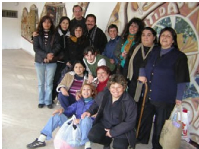
Figura 1 – Parte do equipamento de promoção social de saúde da área de cobertura da Unidade Primária de Atenção da Saúde (UPAS) No 4 de Bo Cárcano, Córdoba, Argentina .

Ao propor de forma mais precisa a problemática, perguntamo-nos se a mudança nas práticas comunicativas e de participação na interação equipe de saúde/população, equipe de saúde/promotoras e promotoras/população facilitou ou não o surgimento de práticas transformadoras quanto à promoção da saúde.