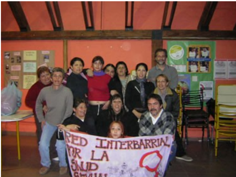
Figura 6 – Promotoras e profissionais quando de sua apresentação na “Rede Interbarrio pela Saúde Sexual e Reprodutiva” da cidade de Córdoba (Ano 2004).

Com esta pesquisa, acreditamos ter realizado uma contribuição ao estudo das práticas de promoção da saúde no âmbito local a partir de um enfoque tridimensional pouco explorado: a articulação entre o social, o cultural e o comunicacional.