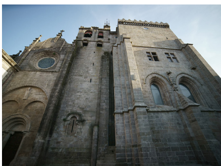
Fig. 2. Fachada norte