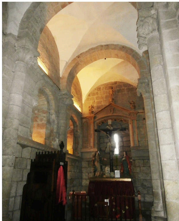
Fig. 6. Detalle de capilla del Cristo de la Agonía en la parte norte del crucero