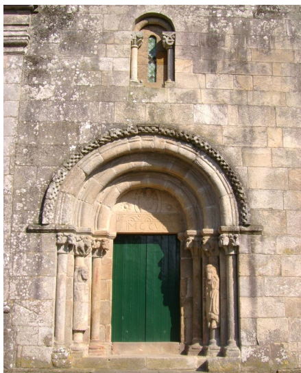
Fig. 17. Portada occidental de la Iglesia de São Pedro de Rubiães (Paredes de Coura, Portugal)