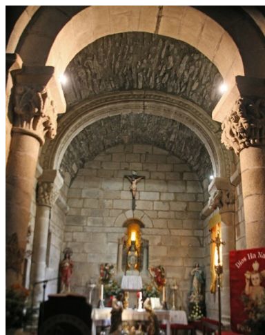
Fig. 16. Vista del ábside de la iglesia de Santa María (Tomiño, Pontevedra)