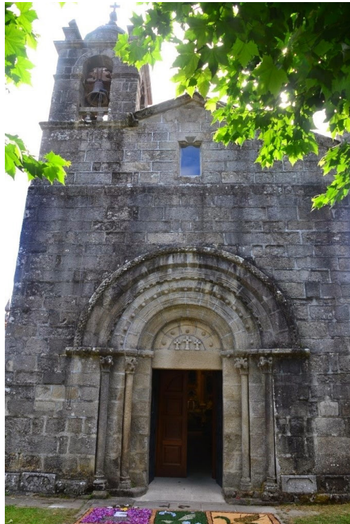
Fig. 13. Portada occidental de la Iglesia de Santa Eulalia de Donas (Gondomar, Pontevedra)