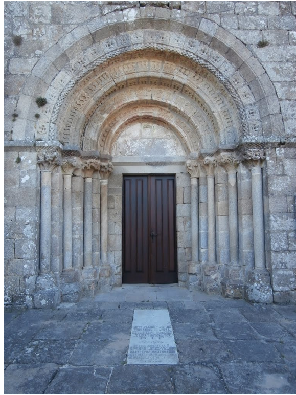
Fig. 15. Portada occidental de la Iglesia de Santa María (Tomiño, Pontevedra)