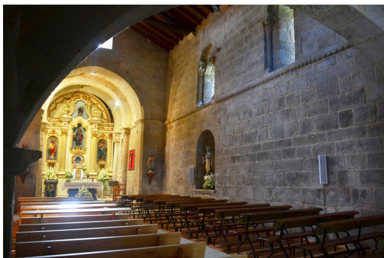
Fig. 14. Interior y ábside de la Iglesia de Santa Eulalia de Donas (Gondomar, Pontevedra)