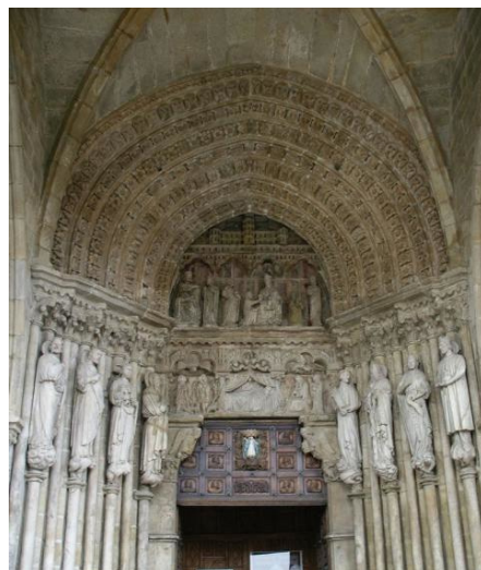
Fig. 9. Portada occidental