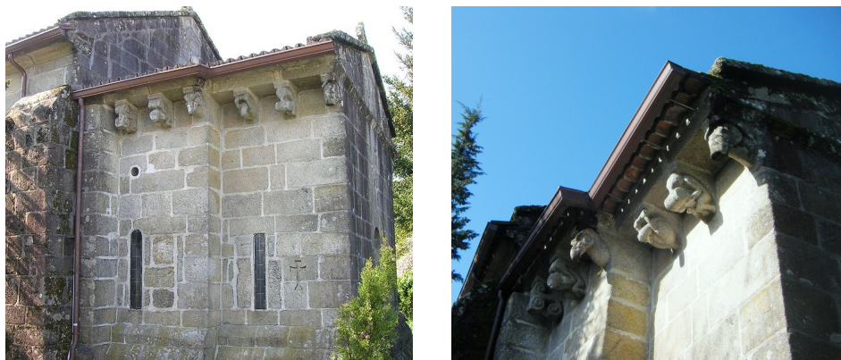
Figs. 11 y 12. Detalle del ábside y los canecillos en San Salvador de Barrantes (Tomiño, Pontevedra)

El arte románico en la antigua diócesis de Tui, además de la impronta dejada por el edificio catedralicio, se extenderá a través de diversas fundaciones monásticas y de las iglesias de patronazgo real o nobiliario. Sin duda, estas características influyen en la calidad de las obras por razones meramente económicas, que permitían tanto la contratación de talleres foráneos y diocesanos de gran calidad. En relación con esta idea debemos destacar tres fundaciones monásticas en el área gallega de la diócesis debidas a Alfonso VII ubicadas en Pontevedra: San Salvador de Barrantes, en Tomiño (figs. 11 y 12), Santa Eulalia de Donas, en Gondomar (figs. 13 y 14), y Santa María de Tomiño (figs. 15 y 16). Se trata de iglesias de monasterios benedictinos coetáneos, ya que sus fundaciones son del segundo cuarto del siglo XII y presentan rasgos estilísticos comunes; especialmente, en la estructura arquitectónica de sus capillas mayores y en la iconografía y la técnica escultórica de sus capiteles y canecillos. Esos aspectos podrían confirmar la existencia de un taller itinerante que, formado o proveniente de la propia catedral de Tui, desarrolla su actividad en los monasterios benedictinos de la zona y extiende su savoir-faire hasta la misma frontera con Braga en los monasterios portugueses de São Pedro de Rubiães, Paredes de Coura, y São Salvador de Bravães, Ponte da Barca 51 (figs. 17 y 18), como podemos apreciar en las estatuas columna de sus portadas occidentales.