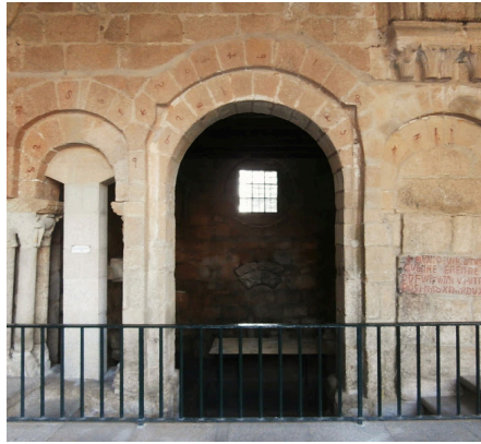
Fig. 7. Sala capitular románica