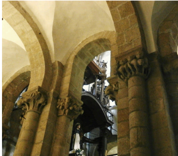
Fig. 5. Detalle del crucero