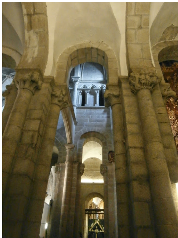
Fig. 4. Detalle del lado sur del crucero