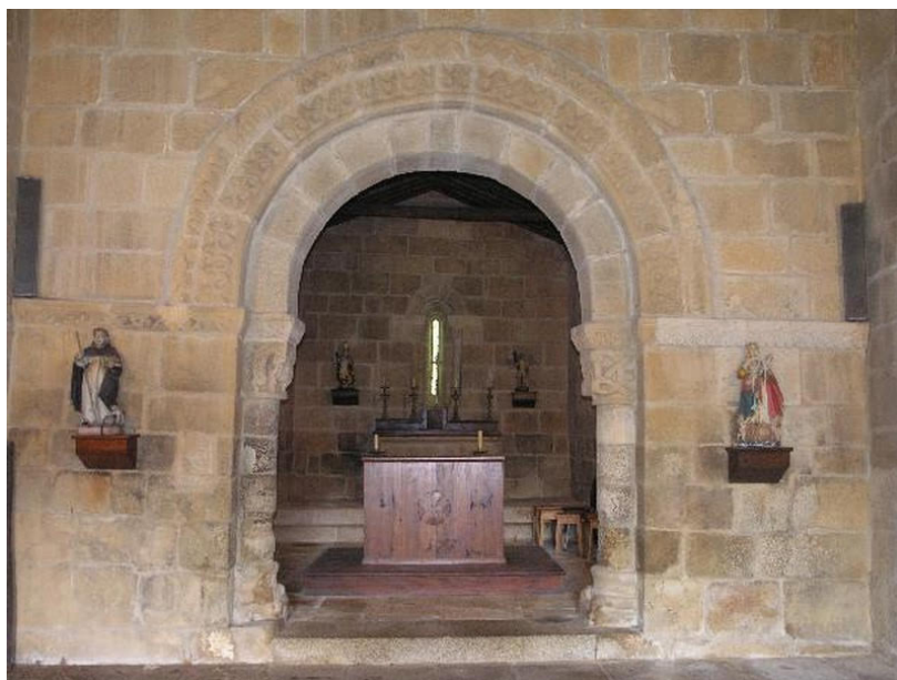
Fig. 20. Detalle de la decoración típica bracarense en la arquivolta de la portada occidental de la Iglesia de São Cláudio de Nogueira (Viana do Castelo, Portugal)

portugueses o bracarense, como es el caso de las arquivoltas con motivos vegetales lanceolados unidos por círculos (fig. 20). Otra influencia en ellos vendrá del arte cisterciense, 54 en un afán por alejarse de la influencia artística de Galicia, y por ende de León.