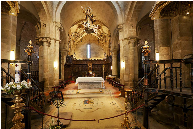
Fig. 3. Vista general del crucero y la capilla mayor