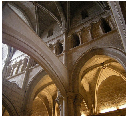
Fig. 8. Triforio y nave en la parte más cercana a la fachada occidental