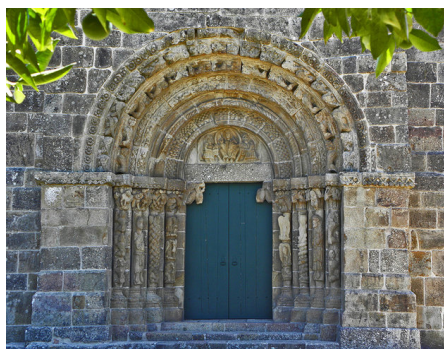
Fig. 18. Portada occidental de la Iglesia de São Salvador de Bravães (Ponte da Barca, Portugal)

En el área portuguesa de la diócesis destacamos una primitiva fundación monástica de doña Teresa de Portugal, posteriormente dotada y acotada por Afonso Enriques, como elemento de innovación en el románico de esta zona. Se trata de Santa María de Ermelo (Arcos de Valdevez, Portugal), cuya cabecera actual (fig. 19) corresponde a un primer período constructivo donde la idea de una planta de triple cabecera fue drásticamente modificada bien por razones económicas o por su anexión al Císter en el siglo XIII. Además, presenta un