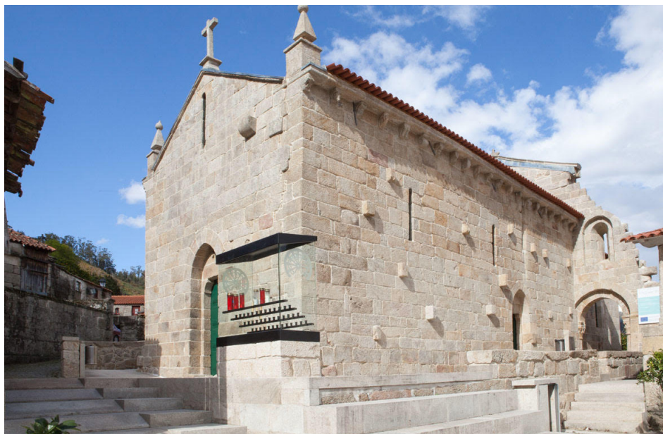
Fig. 19. Detalle de la nave y de la parte de la modificación de la cabecera románica del Monasterio de Santa María de Ermelo (Arcos de Valdevez, Portugal)

aspecto muy diferente debido a las reformas barrocas de las que fue objeto. 52 Este ejemplo pone de manifiesto que en la vertiente portuguesa de la diócesis de Tui tenemos dos grandes tendencias estilísticas: una, influenciada por Tui y los ejemplos gallegos que se concentran en las localidades portuguesas más cercanas a la sede episcopal y al río Miño; la otra, concentrada en los ejemplos más cercanos a la frontera con Braga y al río Limia, cuyos paralelos se encuentran más en relación con Braga y con el arte del Císter 53 .