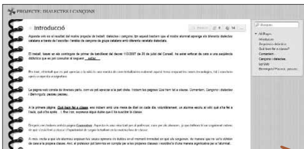
Imatge 5. Wiki sobre els dialectes del català

La revista digital El Suro és un projecte que preten acostar el periodisme a l'alumnat de secundària mitjançant el treball sobre els gèneres periodístics (imatge 6, a la pàgina següent). 11 A més, permet difondre notícies relacionades amb el centre i amb l'educació, recursos i projectes realitzats des de matèries i temes d'interès diferents per a l'alumnat. Els estudiants treballen de manera col·laborativa compartint experiències amb companys, professors i famílies. Els contin-