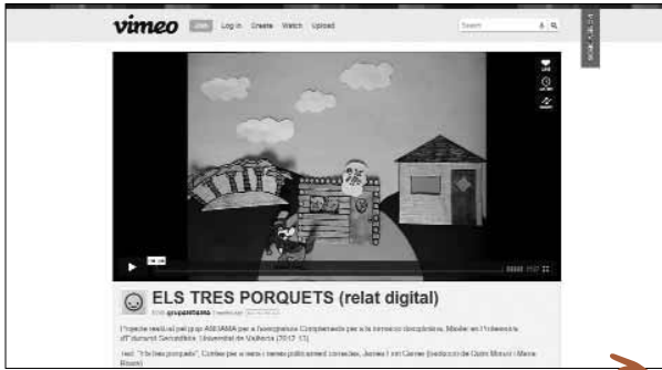
Imatge 3. Relat digital d' Els tres porquets