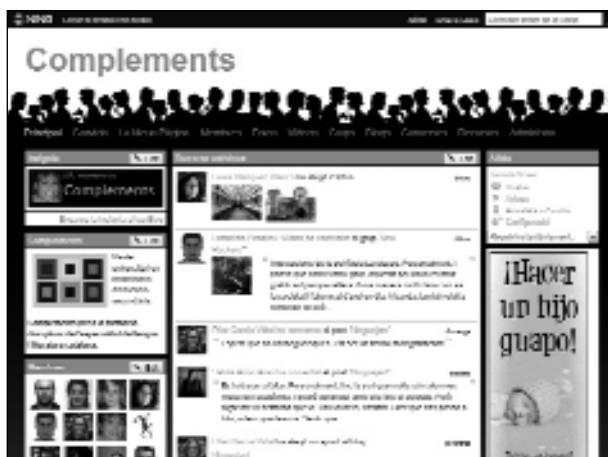
Imatge 1. Pàgina principal del Ning Complements

De fet, dintre les diferents possibilitats que ofereix la plataforma Ning, vam triar la configuració privada, en la qual els qui hi arriben no poden veure la xarxa ni tampoc no hi poden demanar l'admissió. Per tant, únicament s'hi pot accedir per invitació directa per part dels administradors