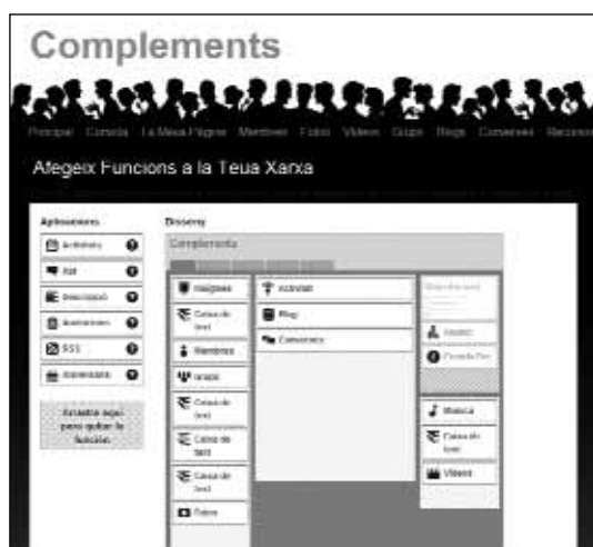
Imatge 3. Pàgina per afegir-hi les aplicacions de Complements

L'ús de la xarxa Ning en Complements ha tingut molts avantatges en la nostra pràctica docent. De fet, la participació en la xarxa ha permès potenciar la interacció comunicativa, el contacte entre professorat i alumnat, la socialització, l'organització, la coordinació, la construcció compartida del coneixement i el treball col·laboratiu. També ha afavorit el desenvolupament de les habilitats lingüístiques i comunicatives, la competència bàsica en les TIC i l'acostament de l'aprenentatge formal i informal. A més, ha funcionat com a centre global de recursos. En concret, com hem pogut comprovar en l'avalua-