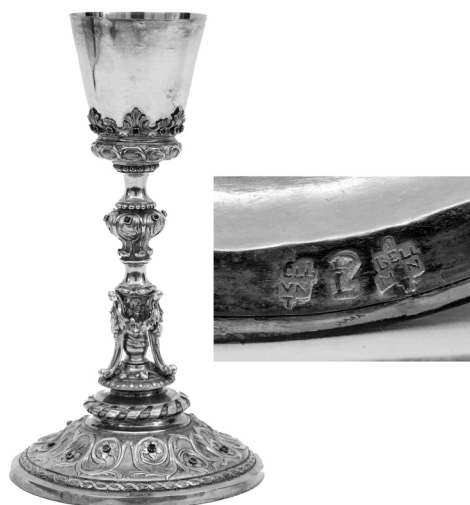
Fig. 3. Josep Bellmont. Cáliz . 1783/84.

dos y de cuerpo entero, al estilo de las piezas labradas en Francia e Italia durante el siglo XIX y principios del XX. El nudo muestra seis botones de esmaltes cloissone y tiene tondos con santos en la sotocopa.