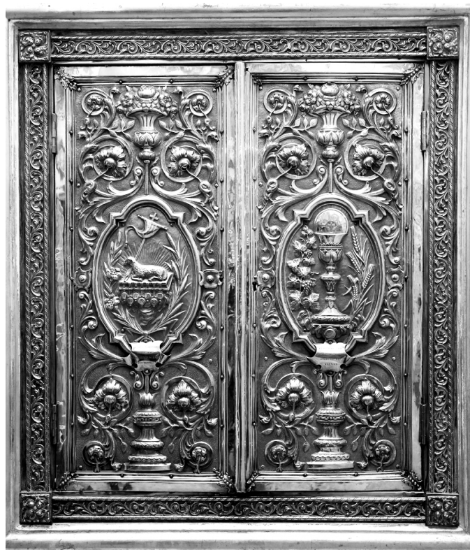
Fig. 5. ¿Miguel Orrico Larocca? Puertas de Sagrario . 1905.

En cuanto a las donaciones de la primera mitad del siglo XX, la más importante es la del cardenal Herrero , fallecido el 9 de diciembre de 1903. Fue él quien legó más objetos para el culto. Los canónigos gastaron 25.722 pesetas de su fondo. El 1 de febrero de 1904 entran veinte juegos de candeleros con veinte cruces grandes, ocho atriles y seis juegos de sacras grandes. Además, catorce juegos completos de manteles para el Trascorario y los altares de la Purísima y Santo Tomás de Villanueva. Unos meses más tarde, el 1 de octubre, llegaron a la Fábrica una docena de candeleros de plata, dos candelabros de tres luces, una escultura de plata blanca que figura el Descendimiento de la Cruz y un jarrón, también todo de plata. 95 Algunas de estas obras, como el Descendimiento o las puertas del Sagrario, permanecen en la catedral. Estas últimas son las más recordadas. El Sagrario antiguamente estaba en el Trascoro y hoy se utiliza para el Monumento del Jueves y Viernes Santos al perderse la Urna (Atribuida a Lluís Puig, 1630) en julio de 1936. El cardenal Herrero heredó plata de su familia, plata que fundida sirvió para las citadas puertas. 96 En el Cabildo del 15 de noviembre de 1905 un canónigo "pidió permiso para que una persona debota pudiera hacer las puertas del Sagrario de plata". Los capitulares acceden y dan "con anticipación las gracias a este bienhechor". 97 Ello indica que la plata del cardenal fue fundida con los do-