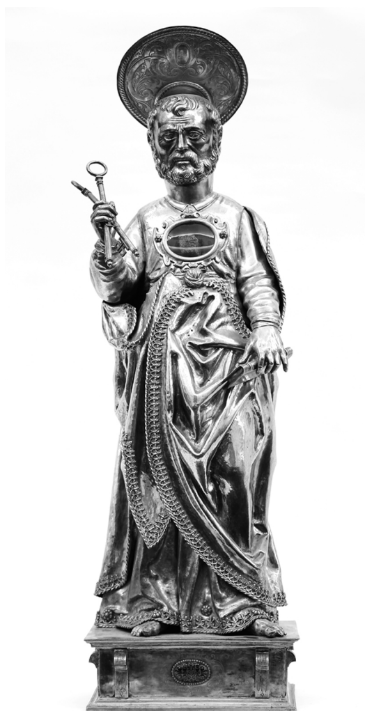
Fig. 8. Plateros valencianos. Imagen-relicario de san Pedro . Siglo XV, 1607 y 1620.

La imagen-relicario de San Pedro (fig. 8) tiene una factura complicada, aunque cada vez es más clara para los estudiosos. La mayoría de los investigadores la datan en el siglo XV, partiendo de la reseña