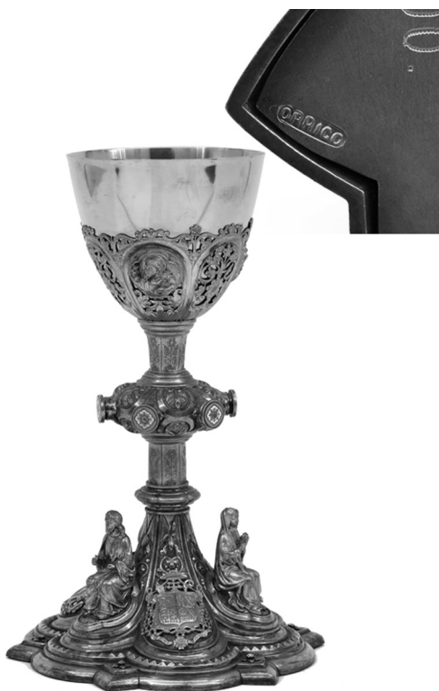
Fig. 4. Miguel Orrico Larocca. Cáliz . 1900.

lámparas. El 15 de febrero de 1785 el canónigo Manuel Navía (1777-1809) expone que un devoto quiere regalar doce blandones de plata para el Altar Mayor cuando exponen el Santísimo Sacramento. Al margen, el libro indica que el donante es el canónigo lectoral Joaquín Gibertó (1767-1796). 81 En el Cabildo del 23 de mayo del mismo año Gibertó regala los blandones de plata. Los labró Bernat Quinzà, platero de la catedral. 82 Años después, figuran en el listado que se hizo en 1811