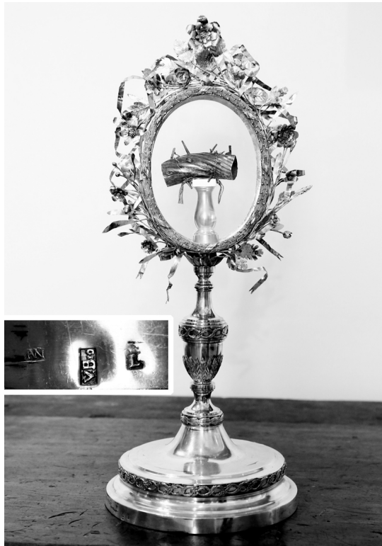
Fig. 6. ¿Josep Alemany? Relicario del ramal de espinas . 1818.