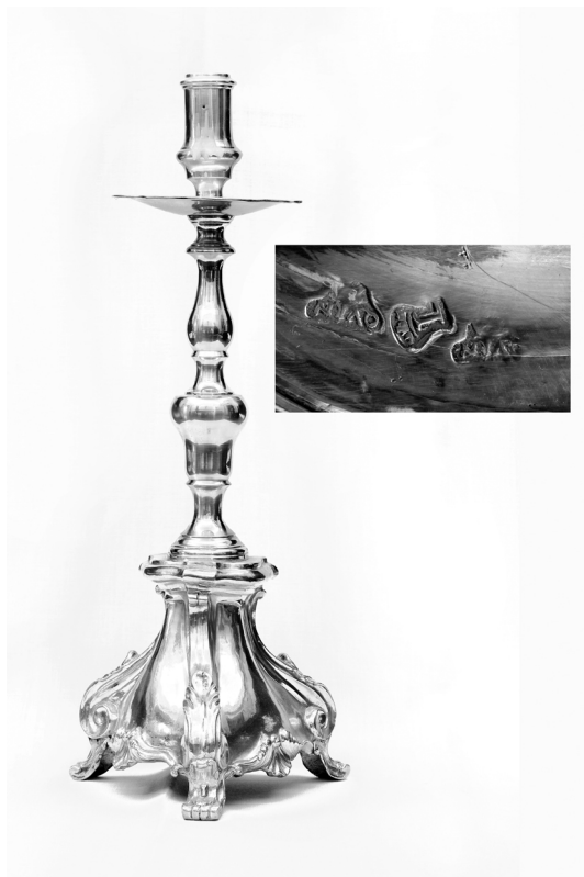
Fig. 1. Gaspar Quinzà. Candelero . 1777.

de los candeleros. Bernat acudió a los capitulares exponiéndoles que su padre había labrado ciento cuarenta y cinco de estos y no había cobrado entonces lo debido. 24