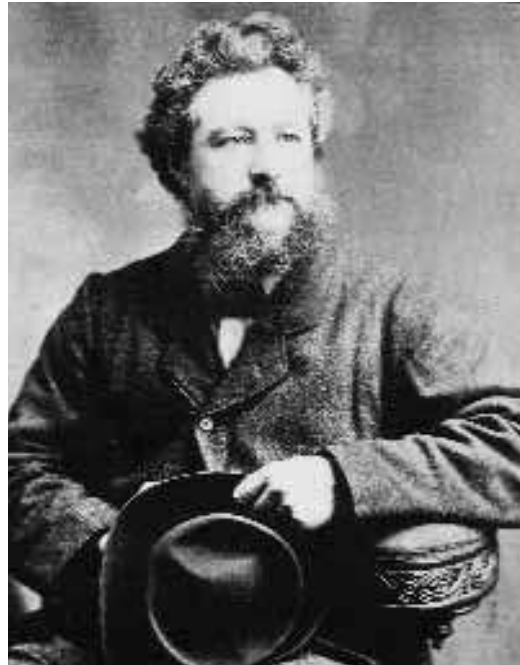
William Morris, 1877

Morris a ruskini példából kiindulva A gyár, amilyen lehetne című cikksorozatában írja le az általa meg-