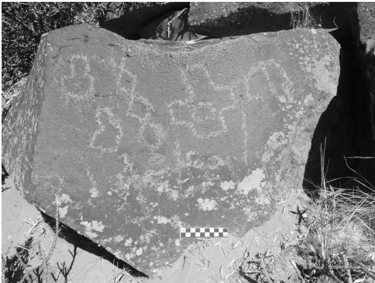
Figura 3. Grabados rupestres sobre bloque basáltico.

restos de anátidos (NISP=24; NMI=3), coipo (NISP= 11; MNI=2) y guanaco (NISP= 32; MNI=1). En el sondeo 2 también predominan las percas (NISP=172; MNI=36), seguidas por coipos (NISP=77; NMI=6) y aves (NISP=8; NMI=2). En ambos sondeos se hallaron además placas dérmicas de dasipódidos y cáscaras de huevo.