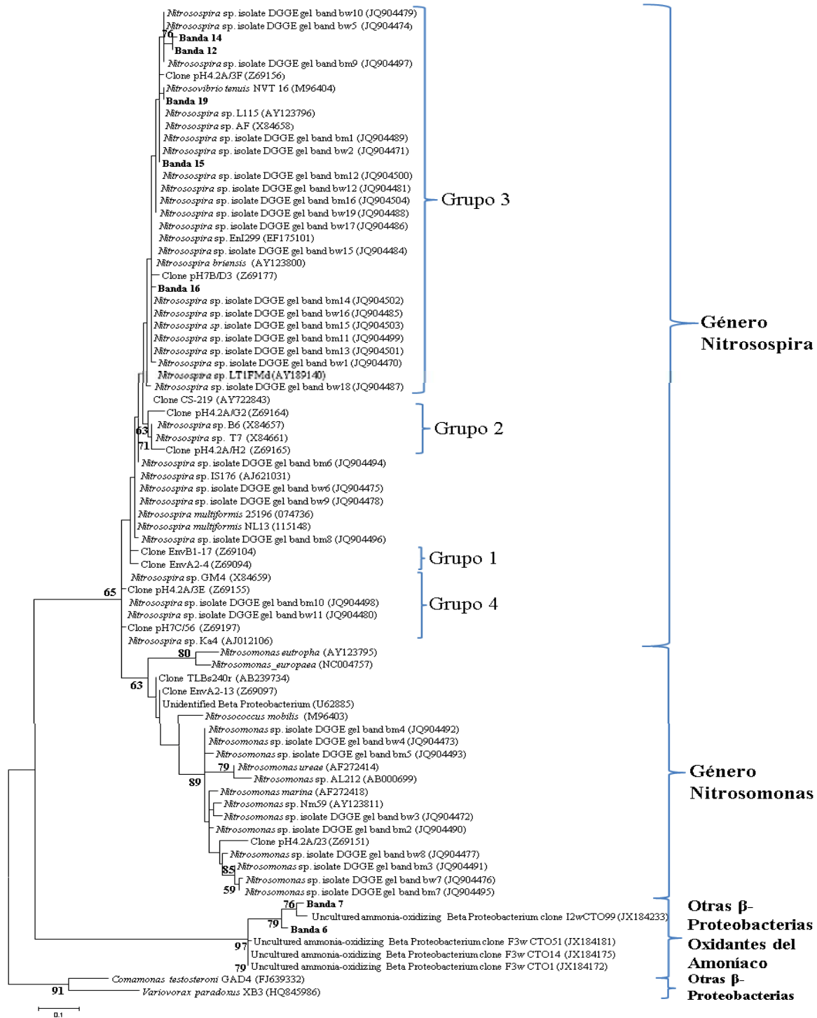
Figura 3. Árbol filogenético de las secuencias parciales del ADNr 16S de BOA, correspondientes a las bandas seleccionadas del DGGE y las secuencias con mayor similitud obtenidas de GenBank. Las secuencias correspondientes a este estudio se muestran en negrita. La escala indica % de sustituciones. Los valores bootstrap se muestran en los nodos.

Figure 3. Phylogenetic tree of partial AOB 16S rDNA sequences of DGGE selected bands in relation to 16S rDNA sequences of the closest uncultured and cultured relatives from genbank. Band sequences from this study are labeled in bold. The scale bar indicates % nucleotide substitutions. Bootstrap values are reported at the nodes.