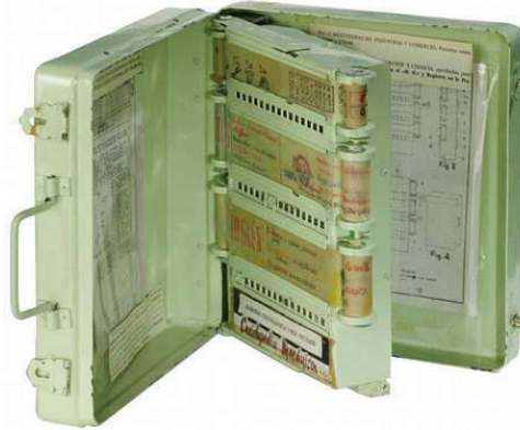
Prototipo de la enciclopedia mecánica de Ángela Ruiz Robles.

Los ejemplos solo buscan traer de regreso, a modo de anagnórisis , a la máquina y su interfaz para entender cuánto nos definen los objetos a los llamados humanistas digitales; y también la tecnología, esa presencia invisible que nos permite dar vida a las cosas y reflexionar sobre sus usos 9 .