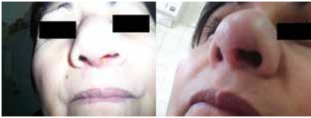
Fig. 1. Lesión infiltrativa, eritematocostrosa y ulcerada, ubicada en alas, punta de nariz y fosas nasales.