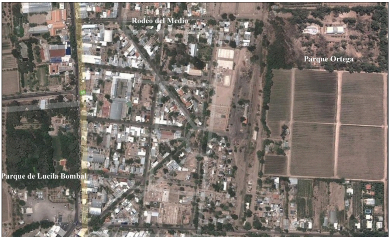
Imagen 2: Vista aérea de Rodeo del Medio 7 (Fuente: Elaboración propia a partir de Google Earth).