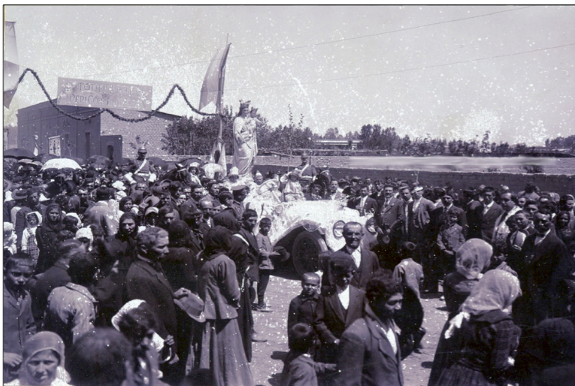
Imagen 13: Coronación de María Auxiliadora en Rodeo del Medio. 8 de octubre de 1916.

El parque del General Ortega se convirtió en un nuevo espacio de sociabilidad popular de la población rural, donde la dimensión religiosa ocupó un lugar primordial (Fresia: 2012, 92). El 8 de octubre de 1916 el Obispo de Cuyo Monseñor Orzali realizó la coronación de la imagen de María Auxiliadora en el Parque Ortega, a la cual asistieron aproximadamente 8.000 personas.