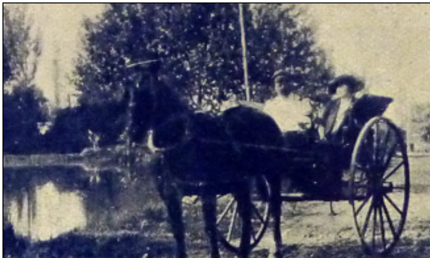
Imagen 11: El Teniente Gral. Ortega y su segunda esposa, Leonor Solanillas, en uno de sus recorridos diarios por el parque. Se observa a la izquierda el lago.