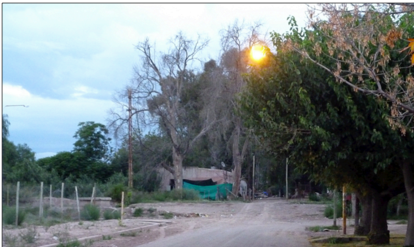
Imagen 17: Foto actual (año 2014) del ingreso al Parque Ortega.