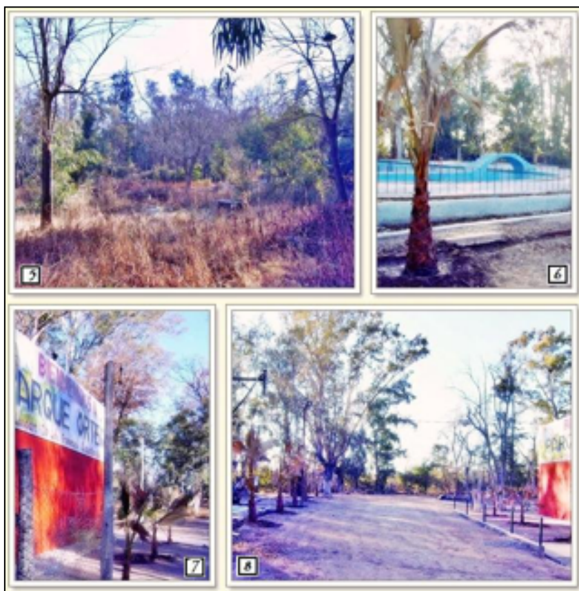
Imagen 16: Estado del Parque Ortega en el año 2011