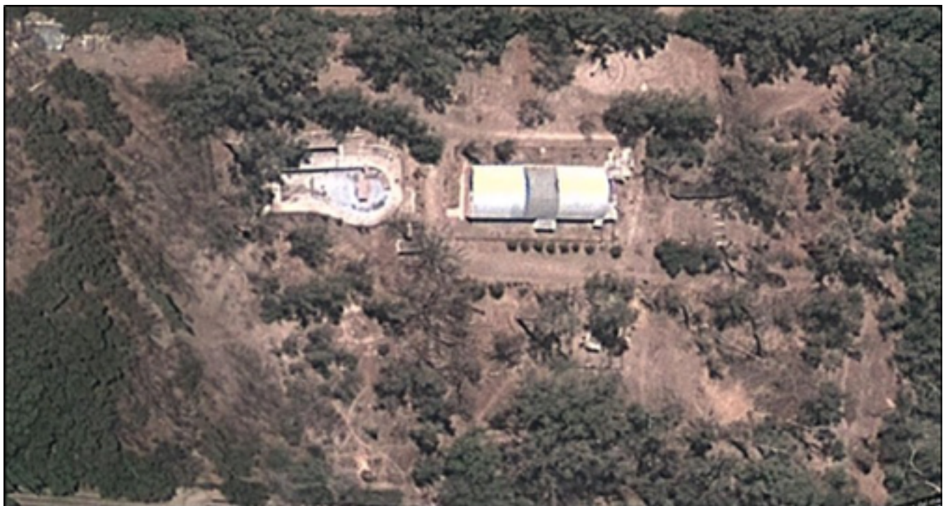
Imagen 3: Vista aérea del Parque Ortega, Rodeo del Medio (Fuente: Google Earth).