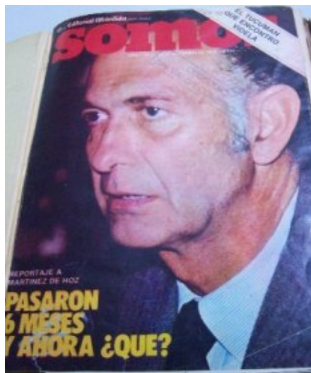
IMAGEN 1. El primer número de Somos , con un reportaje al ministro de Economía de la dictadura en el periodo 1976-1981, José Alfredo Martínez de Hoz, cuya gestión fue apoyada abiertamente por la revista.