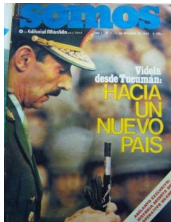
Somos , 1 de octubre de 1976, No. 2, Buenos Aires, Tapa.