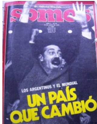
Somos , 30 de junio de 1978, No. 93, Buenos Aires, Tapa.