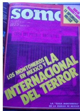
Somos , 26 de agosto de 1977, No. 49, Buenos Aires, Tapa.