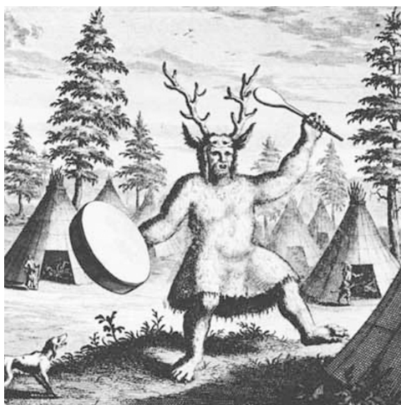
Figura 1. Chamán siberiano dibujado por Nicolaas Witsen (1705) 8 .

En 1705 Nicolaas Witsen, un diplomático holandés que visitaba la corte del zar ruso realizaba un célebre dibujo (ver figura 1). Durante un viaje por las tierras siberianas había visto este tipo de personajes, vestidos con pieles que les daban aspecto de oso, llevando una gran cornamenta de ciervo sobre la cabeza, bailando y tocando rítmicamente su tambor hasta caer en un profundo trance. Durante ese estado hablaban, predecían el futuro, conversaban con los espíritus y los animales, lograban curar a las personas enfermas. Parecían “locos” extraviados que se agitaban, sin embargo gozaban de un gran prestigio en sus comunidades. Según decían, uno de ellos llamado Kōkōchi, había alentado con sus profecías al mismo Gengis Kan, el fundador del imperio mongol. Witsen había dibujado a un chamán siberiano del grupo manchú-tungús.