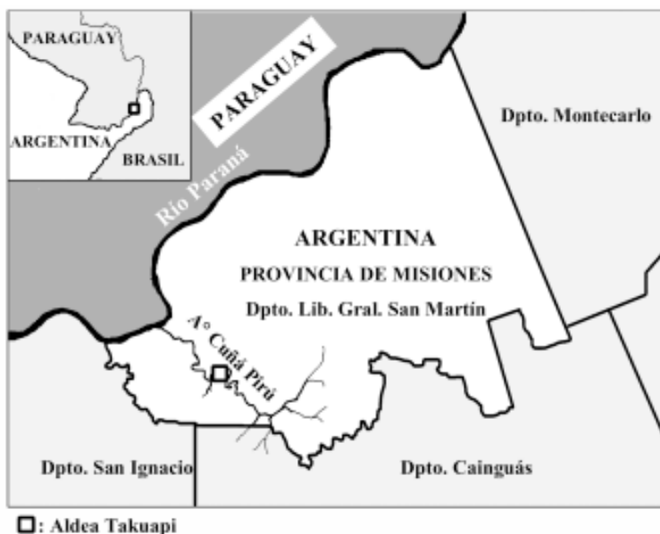
Fig. 1.- Ubicación geográfica de la comunidad Takuapi.

Al tratarse de una superficie reducida se hacen evidentes los problemas relacionados a la disponibilidad de recursos. La escasez de la fauna autóctona constituye un serio problema para etnias carentes de desarrollo pecuario; ha-