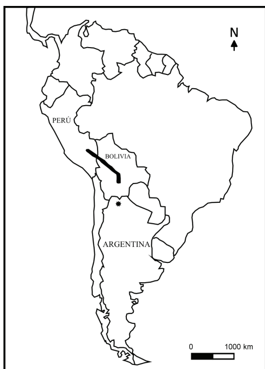
Figura 1. Distribución geográfica conocida del Bailarín Yungueño ( Chiroxiphia boliviana ) en Perú y Bolivia. El punto indica el sitio en donde se produjo el nuevo registro de la especie en Argentina (finca Pintascayo, departamento Iruya, Salta).

El registro del Bailarín Yungueño en Argentina es sumamente notable, dado que los autores han relevado intensivamente desde 2001 distintos sitios de selva pedemontana