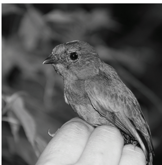
Figura 2. Juvenil de Bailarín Yungueño ( Chiroxiphia boliviana ) capturado en la finca Pintascayo (departamento Iruya, Salta) el 13 de octubre de 2014.