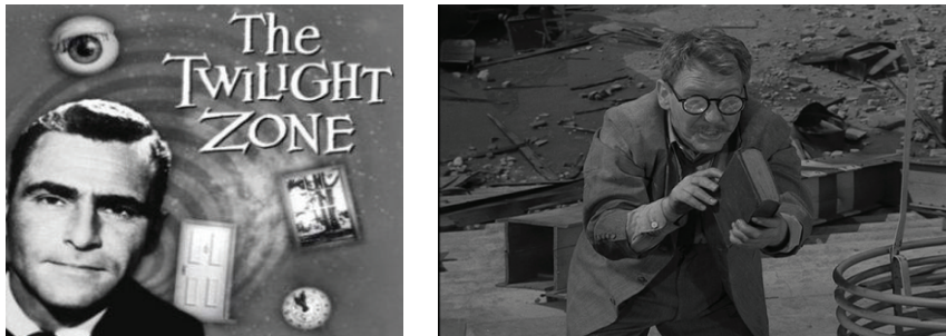
Figura 2. El mundo de los negocios para los científicos: la “dimensión desconocida”

concepciones filosóficas, políticas, religiosas u otras también son fuerzas importantes que definen qué se espera del sistema científico y tecnológico de una nación; ambos temas son tratados en artículos recientemente publicados (Boido y Baldatti, 2012; Vallejos, 2010), que podrán dar al lector la visión más global del problema, que falta en este artículo.