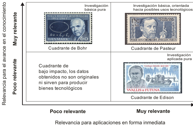
Figura 1. El cuadrante de Pasteur, una concepción de la relación entre la ciencia y tecnología (Stokes, 1997)