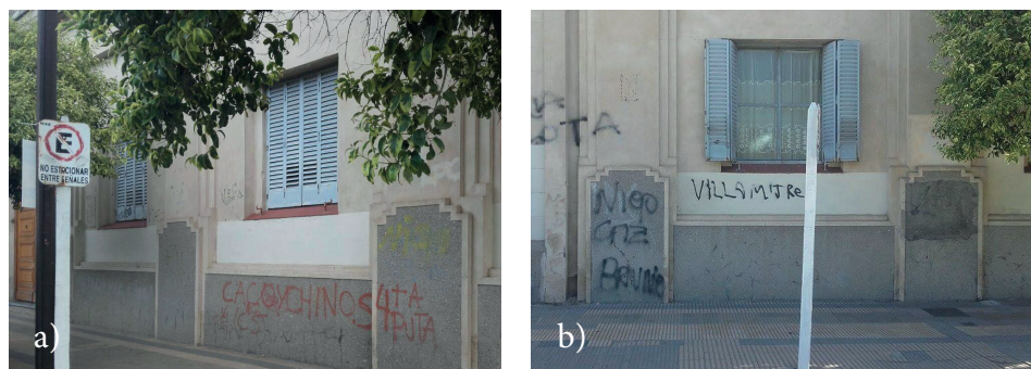
Figura 2. Marcajes de rechazo.

Cuando se valió de la observación participativa, el funcionamiento de las instituciones parece alejarse uno de otro, en un orden estructural: ambos colegios son importantes semblantes de los valores religiosos, pero sus autoridades difieren en términos de ethos y género ; por un lado, las hermanas de la Caridad en el colegio