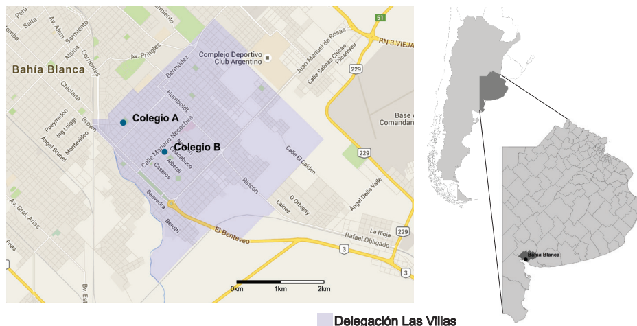
Figura 1. Área de estudio.

Se hizo necesario construir el concepto de identidad escolar tomando como puntapié la perspectiva de Hall (1996) quien define a la identidad como