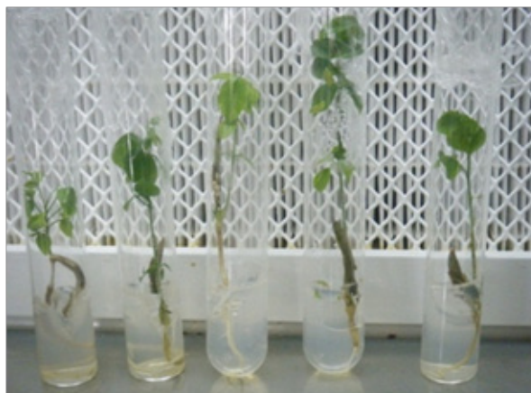
Figura 1. Plántulas de M. frondosus germinadas in vitro , a los 60 días de establecidas.

En el tratamiento de desinfección de semillas con hipoclorito de sodio al 1%, el porcentaje de desinfección fue del 36% de las semillas tratadas y el 64% restante se contaminaron con hongos. En las semillas tratadas con hipoclorito de sodio al 3%, se logró un 6,5% de semillas germinadas in vitro ( Figura 1 ); si bien un 12,4% de las mismas presentaron contaminación con hongos (porcentaje menor al que mostró el tratamiento con hipoclorito al 1%); el 80,4% de las semillas de este tratamiento mostraron contaminación con bacterias endógenas ( Gráfico 1 ), las cuales no se observaron en el tratamiento con hipoclorito de sodio al 1%, debido a la alta tasa de contaminación úngica que presentó.