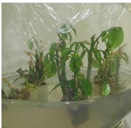
Figura 2. Brotes de M. frondosus desarrollados a partir de un segmento nodal durante el tercer subcultivo, con 40 días. Figure 2. Buds of M. frondosus developed from a nodal segment during the third subculture.

Tras efectuar el análisis de varianza (ANOVA) para la variable coeficiente de multiplicación, no se observaron diferencias significativas entre los tratamientos evaluados en el subcultivo 4. En cambio, en el subcultivo 5 se observaron diferencias significativas entre los tratamientos; los mejores resultados se obtuvieron con el tratamiento 4 (1 mg/L de 6-BAP y 0,1 mg/L de ANA) con un coeficiente de multiplicación de 2,66, seguido del tratamiento 3 (0,5 mg/L de 6-BAP y 0,1 mg/L de ANA) con coeficientes de 2,29 ( Gráfico 2 ).