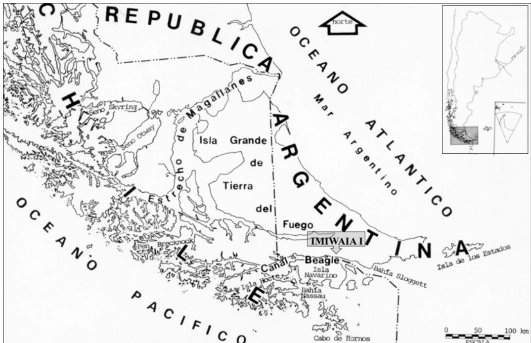
Fig. 1. Localización del sitio Imiwaia I.

Investigaciones más recientes en Imiwaia I han proporcionado evidencia de ocupaciones cazadoras-recolectoras durante el Holoceno temprano (Piana et al. 2012). En la capa S -estrato basal del sitio se registró una ocupación con una cronología de 7.842 \pm 53 años AP (8.420-8.662 cal. AP; Calib 6.0, 2 \delta curva SHCal04, McCormac et al. 2004). Dicho estrato tiene una potencia que varía entre los 6 y 12 cm en toda la extensión excavada (80 m 2 ). En