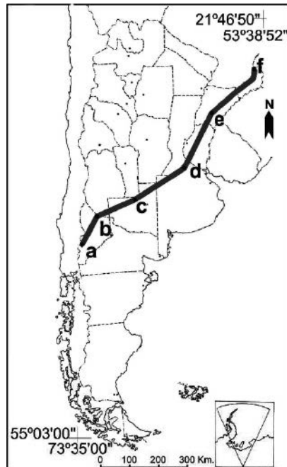
Fig. 1. Localización de los sitios de análisis (a-f) a lo largo de la transecta SW-NE.

La localización de la transecta SW-NE se presenta sobre la imagen obtenida de NDVI medio (Figura 1). Los parámetros (imágenes) de Fourier seleccionados para ser graficados a lo largo de la transecta son: NDVI medio, amplitud a 9, 1 y 0,5 años y fase a un año porque son los que explican las variaciones fenológicas a lo largo del gradiente climático (Figura 2). Los valores graficados fueron extraídos pixel a pixel de las correspondientes imágenes, a lo largo de la transecta, con sus localización en latitud y longitud. Se describe como varía cada parámetro a lo largo de la transecta considerando las unidades fitogeográficas: bosques andino-patagónicos, Estepa arbustiva Patagonia-monte, sabanas pampeanas (caldenal), pastizales pampeanos (en región de agricultura intensiva), sabanas mesopotámicas y selva misionera.