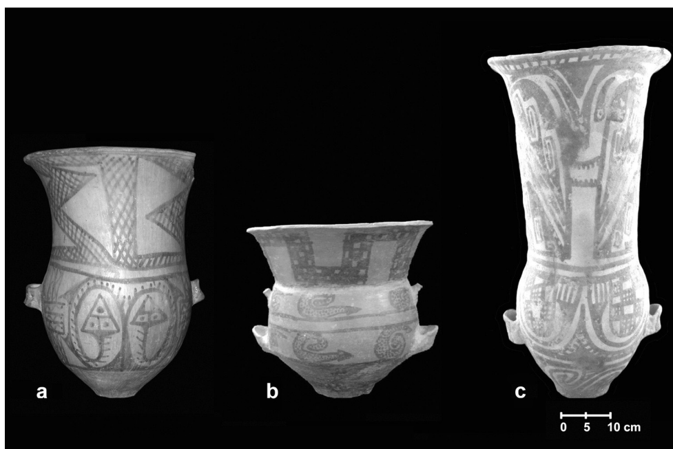
Figura 1. Ejemplos de urnas. a: Negro sobre Rojo tardía de Yocavil, Fuerte Quemado, Museo Etnográfico “Juan B. Ambrosetti”, N° 44-1924, col. Breyer. b: Belén, IAMUNT, col. Schreiter (Base de datos IAMUNT 2003). c: Santa María, Rincón Chico, Museo “Eric Boman”.

Las alfarerías Santa María y Belén comparten expresiones estéticas, simbólicas y pautas de uso. Ambas producciones constituyen los estilos con baños y pinturas mayoritarios en sus respectivas áreas de referencia. Comparativamente la frecuencia de hallazgos de tinajas Negro sobre Rojo Belén – Santa María es muy baja. En base a una revisión bibliográfica y de colecciones de museos hemos identificado 43 ejemplares completos. Estas urnas comparten con las tinajas Belén el uso de pintura negra sobre un fondo rojo alisado o pulido, la aplicación de baño rojo en la superficie interna del cuello, la distribución de los campos decorativos, ciertos motivos y modos de representación. Por su parte, comparten con las tinajas Santa María bicolor rasgos como el predominio de cuerpos ovaloides, la tendencia al desarrollo de los cuellos largos, ciertos modos de representación de la serpiente y de “guerreros” en algunos ejemplares. A pesar del “equilibrio” de rasgos de ambos estilos en las urnas Negro sobre Rojo, no ocurre lo mismo con el ámbito geográfico en el cual circularon, siendo los hallazgos mucho más frecuentes en la zona de Yocavil y alrededores (Figura 2). El estudio de varios contextos de hallazgo indica que esta modalidad estuvo vigente posiblemente entre los momentos finales del Período Tardío, la época de expansión incaica en el Noroeste argentino y el Período Colonial Temprano (Marchegiani et al. 2009).