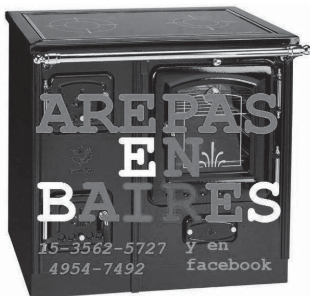
Figura 1. Microemprendimiento de estudiante colombiano en Argentina.

Es una población que viene a capacitarse bajo diferentes programas de becas como las del Instituto Colombiano de Crédito y Estudios Técnicos en el Exterior (ICETEX) 6 . También utilizan otras estrategias para costear su capacitación, como la inserción laboral en la sociedad de destino en el rubro gastronómico —camareros a microemprendedores— y/o trabajadores en servicios y en ventas — call centers — (Duque y Raffani, 2009). Son numerosos los microemprendimientos de venta de comida colombiana por la web , en especial por Facebook. Algunos ejemplos: Arepas en Baires, Mercadito Colombiano, Arepas Comeme en Baires y Arepas Empanadas Colombianas La Tata, entre otros.