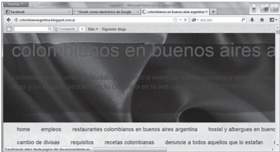
Figura 2. Colombianos en Buenos Aires, Argentina.

Por sobre la inserción laboral y residencial existen diversas prácticas sociales que tienen que ver con el tiempo libre y vinculan a estos jóvenes migrantes con la sociedad receptora y entre ellos como colectivo. La “movida cultural” que ofrece Buenos Aires, con su gran oferta de cursos de perfeccionamiento, idiomas, teatro, etcétera, así como las fiestas temáticas de la misma colectividad —donde predomina la música colombiana— o la realización de distintas actividades por el movimiento político colombiano en el exterior, constituyen modos de socialización de estos migrantes.