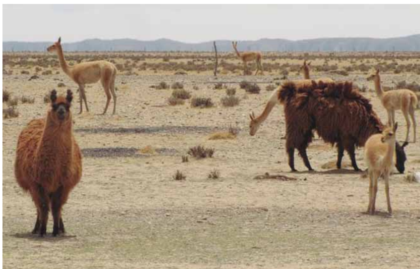
Figura 1. Vicuñas y llamas compartiendo unidades de vegetación en Santa Catalina (Jujuy).

Si bien los camélidos silvestres y domésticos tienen un diseño anatómico similar, se pueden apreciar notables diferencias fenotípicas: tamaño, color —tanto en los tonos como en su distribución corporal—, características del pelaje (bimanto menos marcado, etcétera). La distinción de variedades de alpacas y llamas es