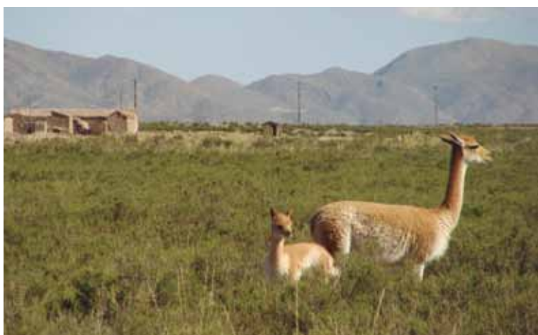
Figura 3. Vicuñas habituadas alimentándose muy cerca de viviendas en Santa Catalina (Jujuy).