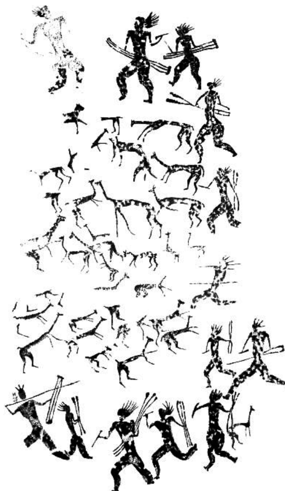
Figura 4. Representación de caza por encierro en el sitio 2Loa 15/13, Estilo Confluencia. Dibujo: Bernardita Bráncoli, gentileza de Francisco Gallardo. Nótese a las vicuñas en actitud de huida.

son diferentes, como así también es distinta la actitud de estos ante la presencia humana y la de los humanos frente a ellos, en el primer caso como cazadores, y en el segundo, como protectores de la manada.