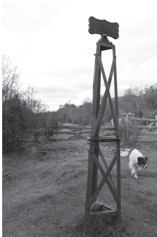
Figura N° 4 Hito, símbolo del límite estatal entre Chile y Argentina