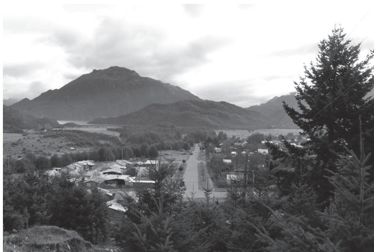
Figura N° 3 El paso Las Pampas-Lago Verde como "frontera cotidiana"