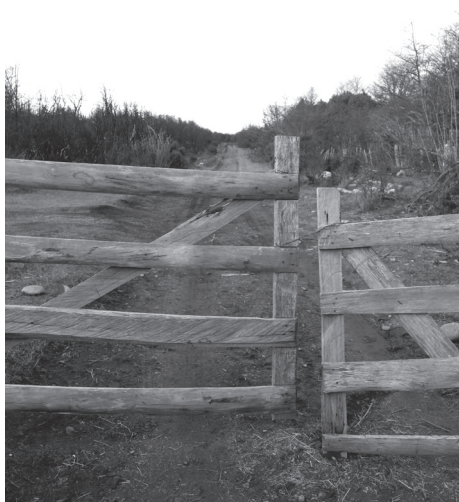
Figura N° 1 Límite divisorio “lagoverdino-pampeño”

Fuente: Archivo fotográfico de los autores (mayo, 2014)