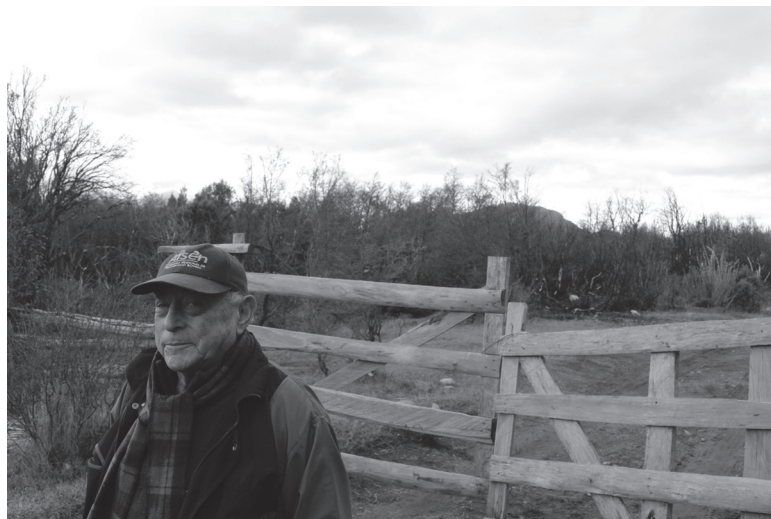
Figura N° 5 Un "Solís" en la "frontera"