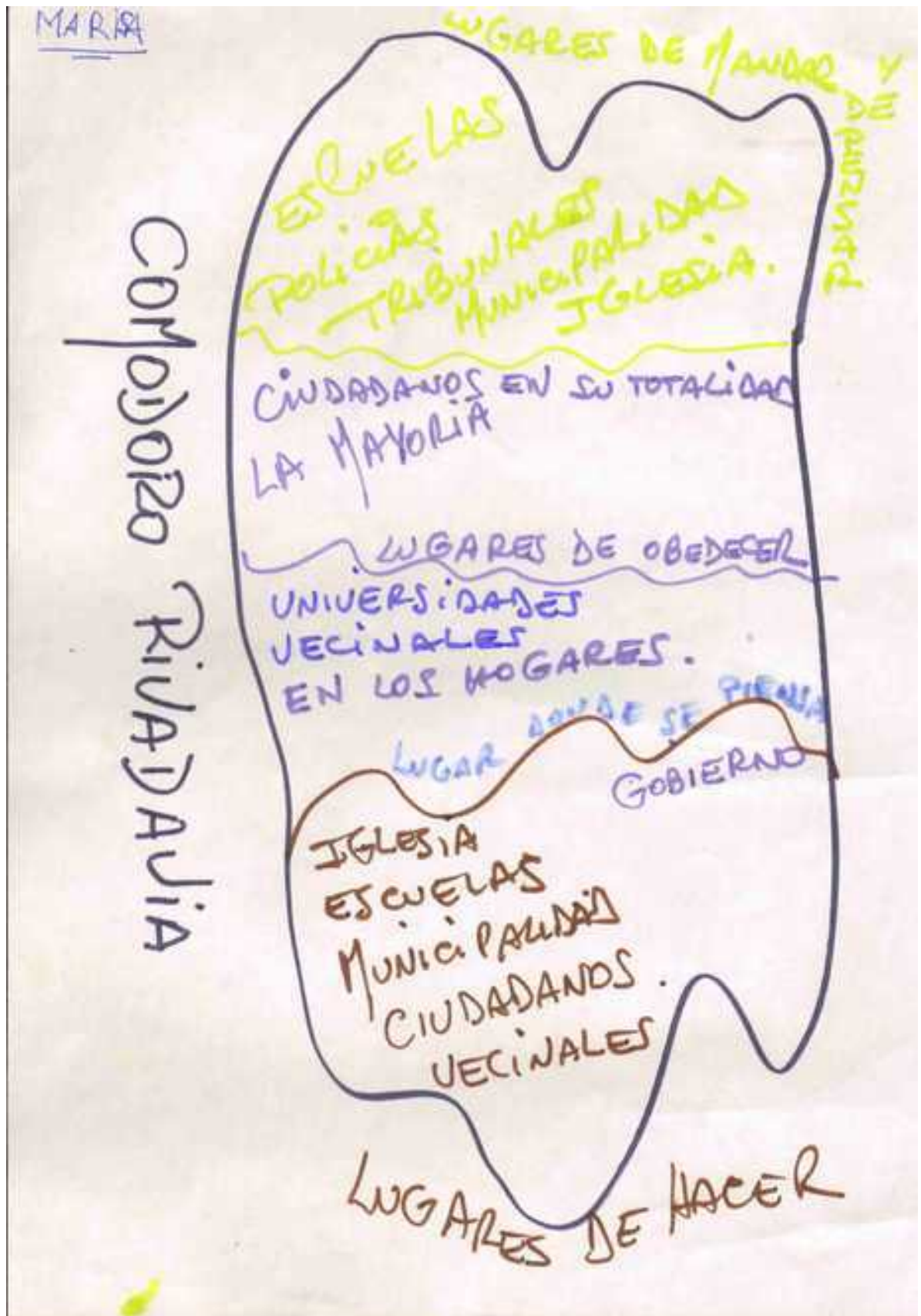
Mapa ejemplo 1