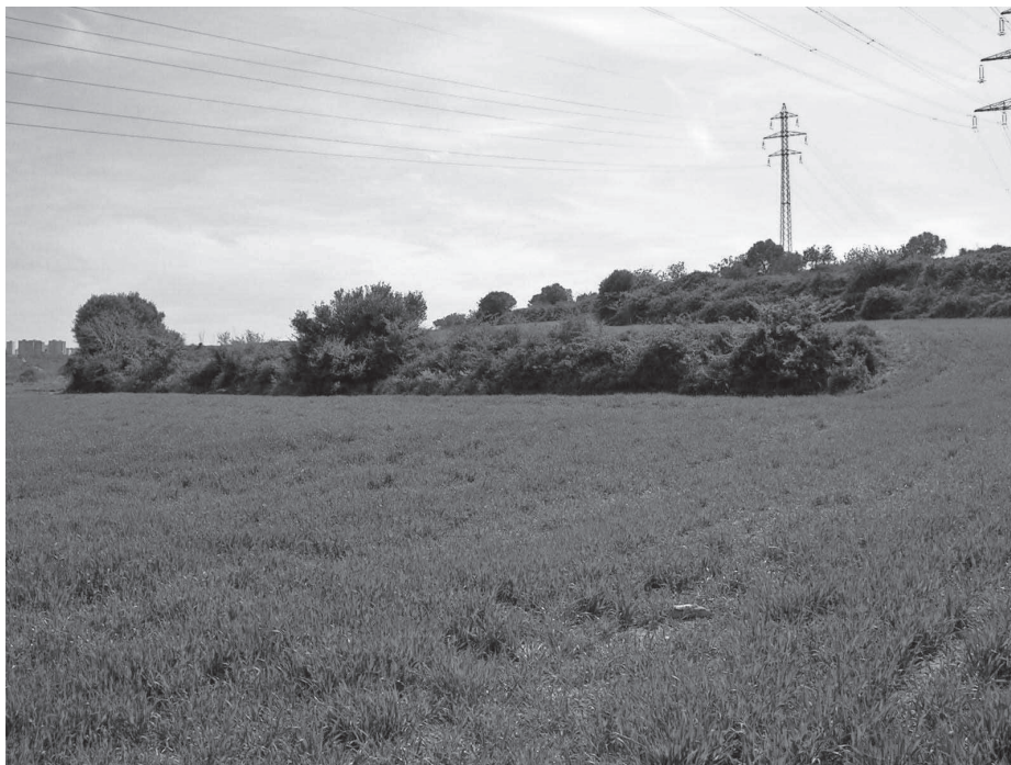
Conreus de cereal i tanques arbrades conserven els millors espais on encara podem observar fauna.

Entre els 90 i 2000, s'observa un clar descens de la fauna per aïllament genètic i transformació en els usos del sòl (urbanitzacions, infraestructures perimetrals), que han anat escanyant l'espai.