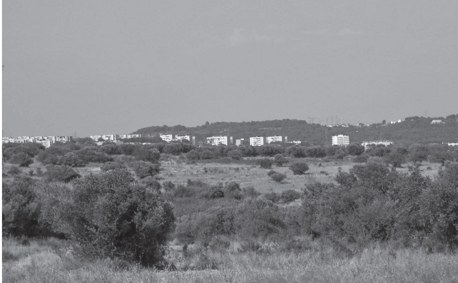
Conreus de secà abandonats fa molts anys, són molt importants per la biodiversitat per la gran quantitat de cavitats que mantenen les seves soques.