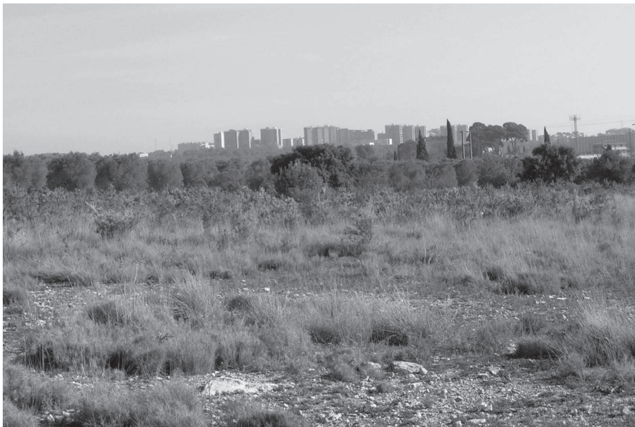
Als herbassars i aliagars de Rabassols també hi viuen unes espècies molt interessants.