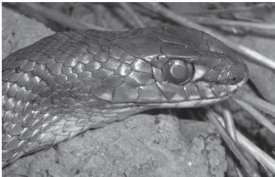
La serp verda ( Malpolon monpessulanus ) és un gran superpredador mediterrani que s'alimenta bàsicament d'altres rèptils, i que tanmateix està patint molt a conseqüència de la pressió humana (tràfic rodat, aïllament genètic).