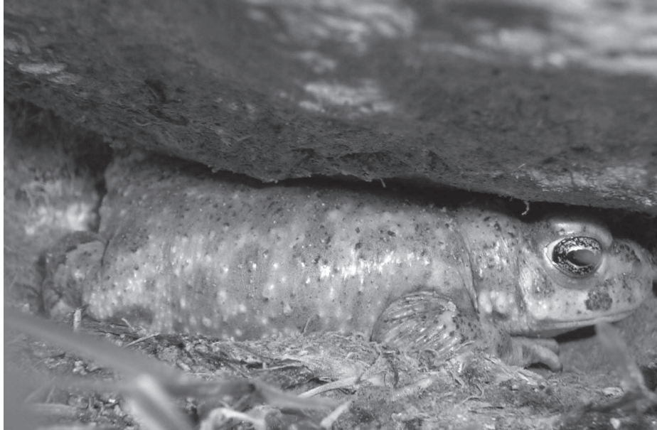
El gripau corredor ( Bufo calamita ) ha patit també una reducció en els seus efectius.