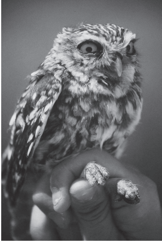
El mussol comú ( Athene noctua ) destructor d'insectes i rosegadors ha estat afectat per la falta de cavitats on poder nidificar.