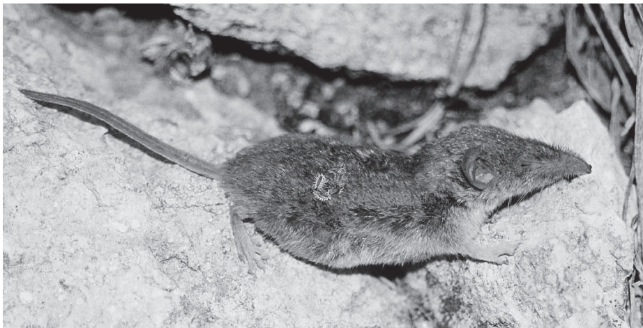
La musaranya ( Crocidura russula ) ha vist reduïdes les seves poblacions per l'aïllament genètic provocat per infraestructures.