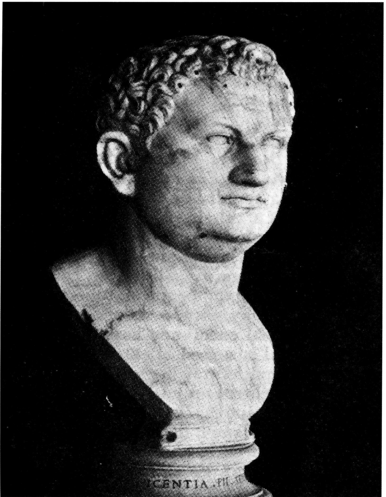
Bust de Tit. Escultura antiga. (Museu Vaticà)