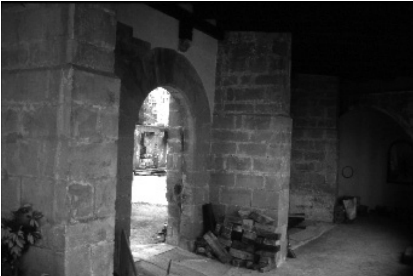
figura 8: Porta d'accés a una antiga dependència (avui en ruïnes) del convent.