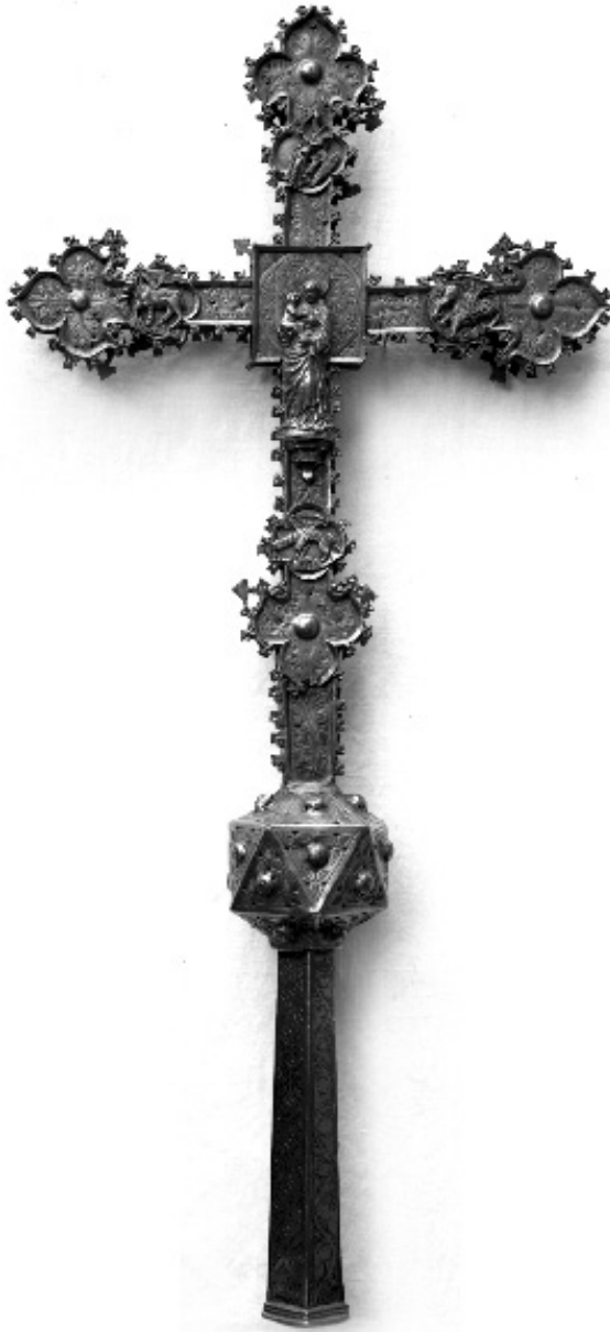
figura 11: Creu gòtica d'aram que es conservà al convent de santa Clara de Tortosa fins l'any 1936.