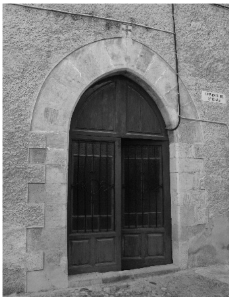
figura 5: Porta d'accés al claustre del convent.