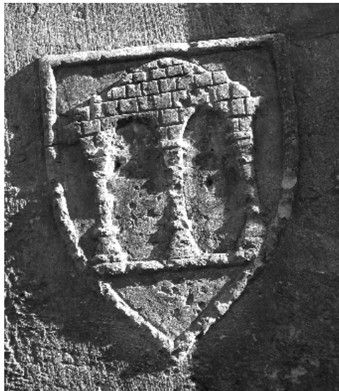
figura 4: Element heràldic gravat a la porta de l'antiga infermeria.