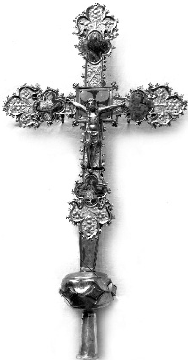
figura 12: Creu gòtica d'argent que es conservà al convent de santa Clara de Tortosa fins l'any 1936.