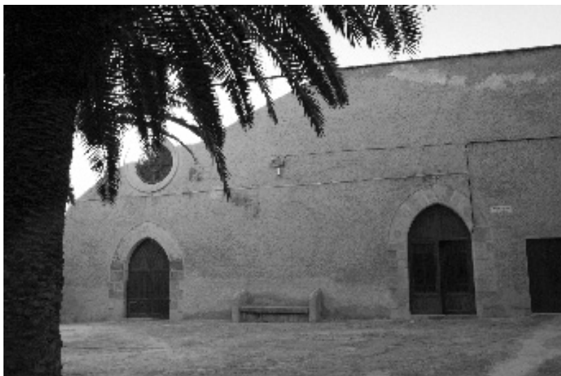
Figura 1: Façana del convent de santa Clara de Tortosa.