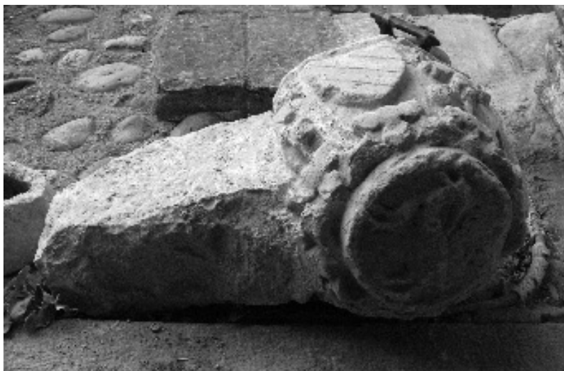
figura 9: Pica beneitera en pedra del convent.