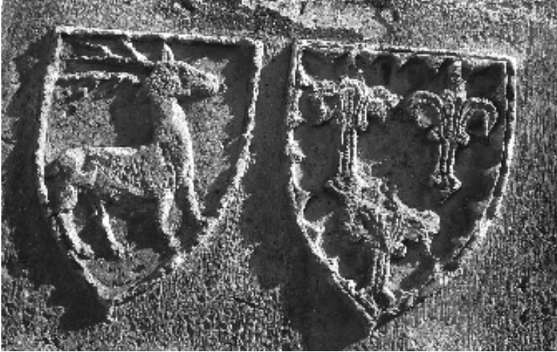
figura 3: Element heràldic gravat a la porta de l'antiga infermeria.