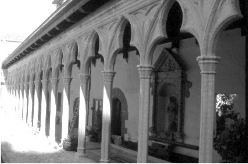
figura 7: Claustre.