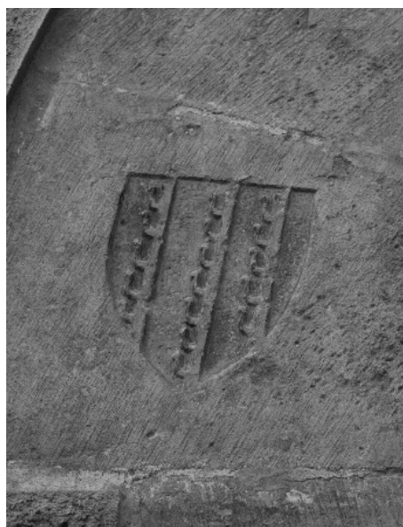
figura 6: Element heràldic gravat a la porta del cenobi.