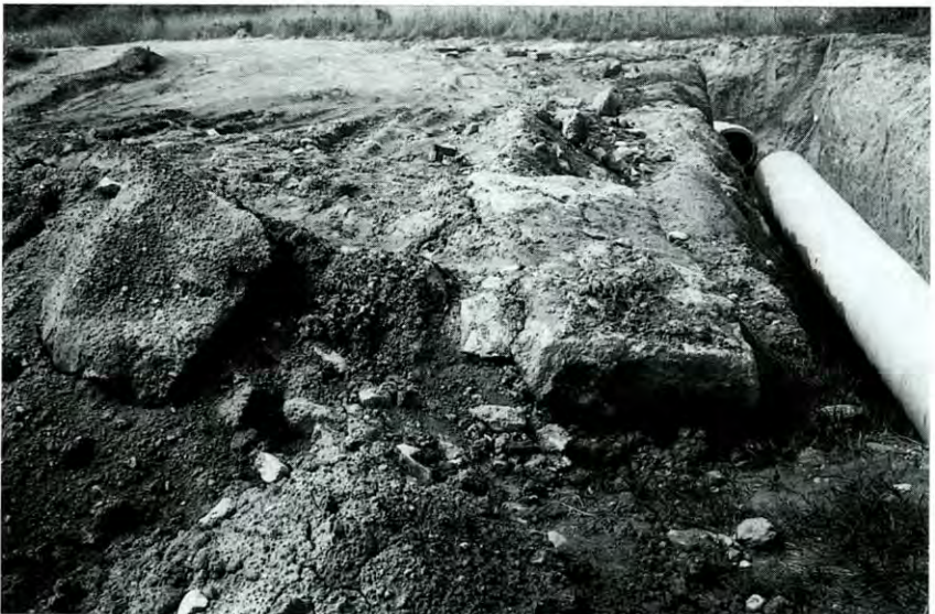
Làmina Ib. Carreus extrets per les excavadores.