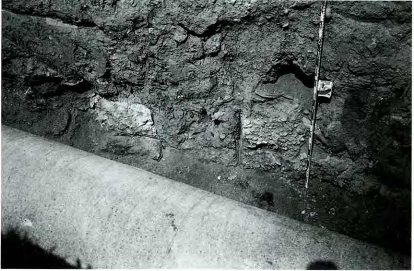
Làmina Ia. Aqüeducte romà seccionat.