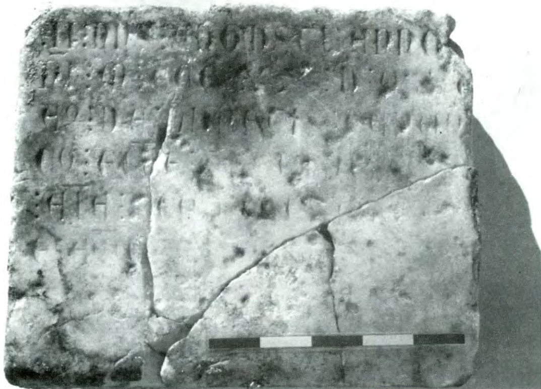
Figura 2.-Detall de la lauda sepulcral.