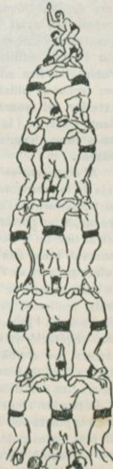
El quatre de vuit