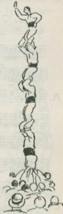
El pilar de cinc

Es pot fer aixecat per baix, i la manera de fer-ho és, que diversos homes l'aixequen agafant per les cames el que ha d'ésser aixecat fins que hi cap l'altre. Es el més difícil.